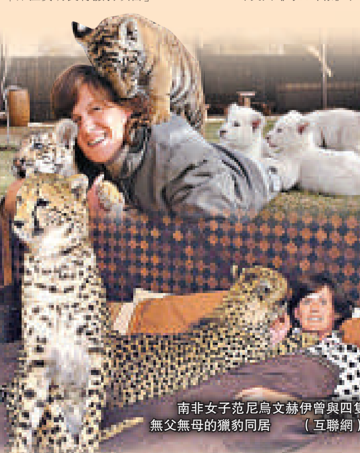
南非女子范尼烏文赫伊會與四隻無父無母的獵豹同居