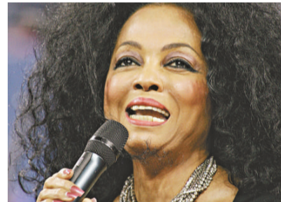
遺囑指名歌手兼米高的知己 Diana Ross 為米高三名子女の後備監護人