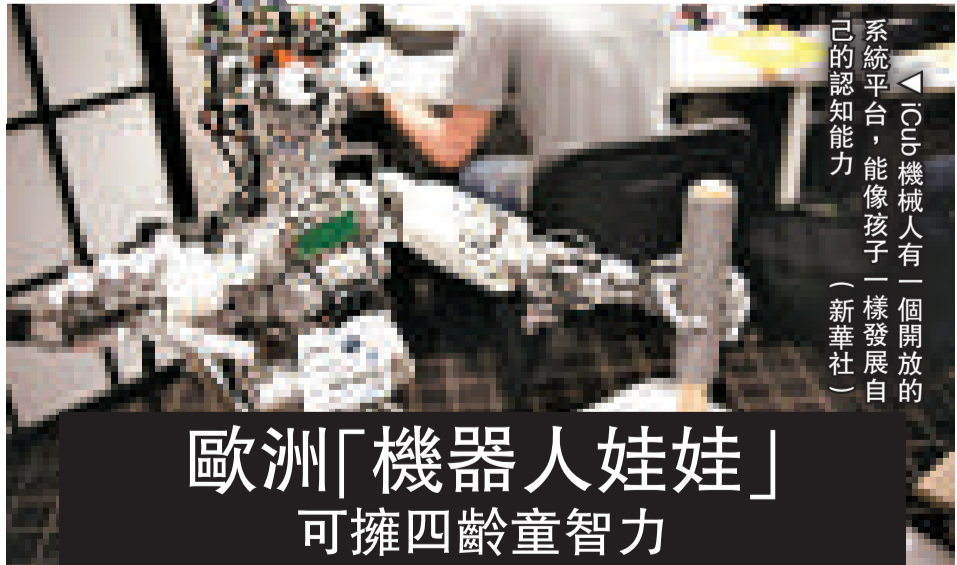
系統平台，能像孩子一樣發展自己的認知能力