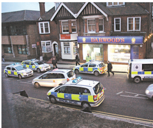
調查顯示，英國是全歐洲最多暴力罪行的地方

另外還有暴力的程度的問題。英國雖然在暴力罪案方面排名比南非高，但南非每年發生超過二萬宗謀殺案，而英國〇七年只發生了九百二十一宗。警察部長漢森批評這些數字有「誤導性」。他說：「不同國家的警方記錄的罪案數字是不能比較