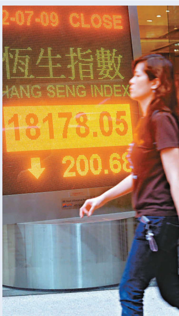
港股昨日高開 402 點後急挫 325 點至 18053 點，惟臨近收市前，人民銀行等六部委頒布人民幣結算試點辦法，刺激港股跌幅略為收窄，恒指收市報 18178 點，跌 200 點或 1.09% (中通社)

此外，配股集資逾 15 億的合眾泰富 (01813)，復牌後股價最多跌 7.7%，低見 5.15 元，收市跌 6.45% 至 5.22 元，是一眾內房股中表現最差的股份。