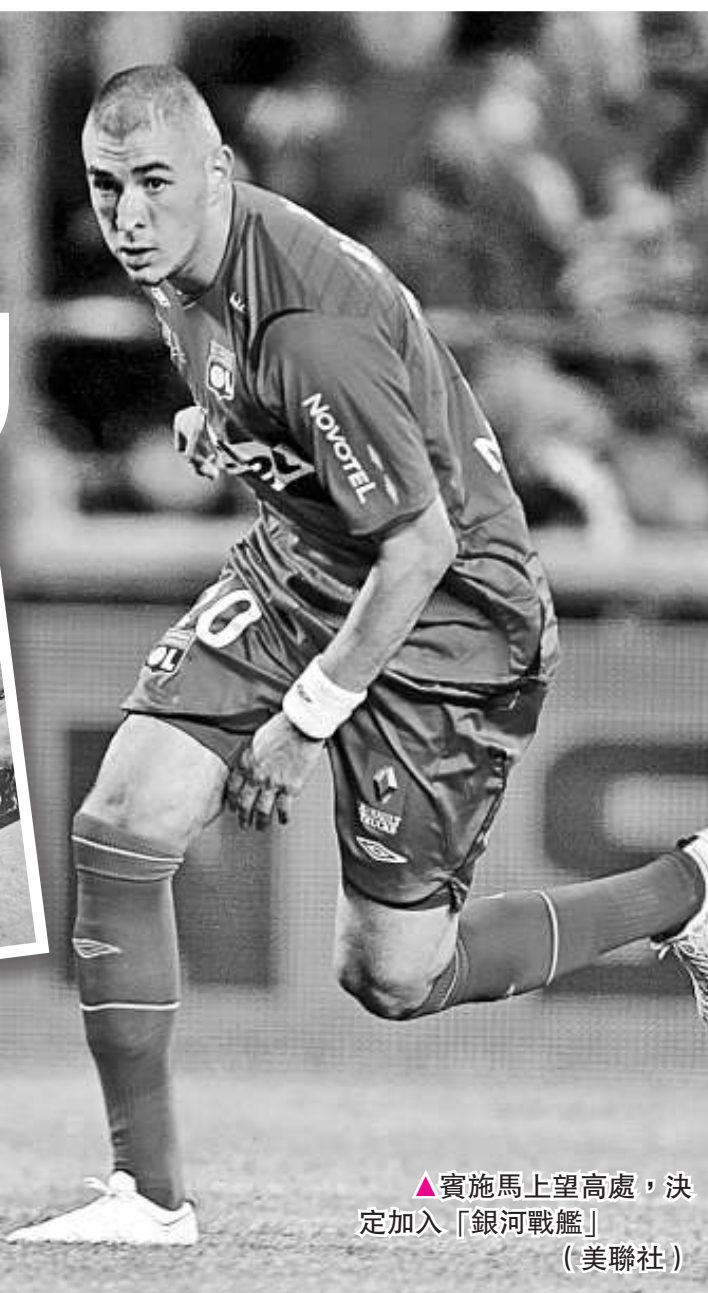
▲賓施馬上望高處，決定加入「銀河戰艦」（美聯社）