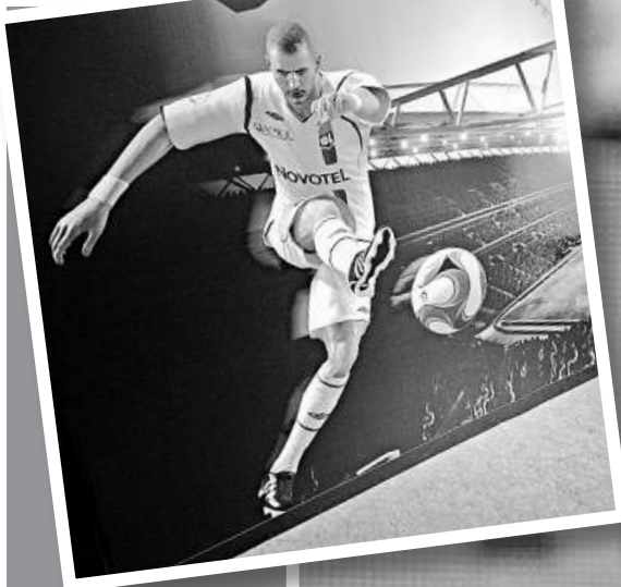
▲在以後推出的足球電玩遊戲中，虛擬的賓施馬也要改披皇馬戰衣

賓施馬已經是皇馬主席佩雷斯上任後的第4個重大收購，之前皇馬先以6500萬歐元買下卡卡，又以9400萬歐元將C朗拿度帶到班拿貝，隨後華倫西亞的西班牙國腳後衛艾比爾又以1500萬歐元加盟，再加上賓施馬的至少3500萬歐元，皇馬暫時已經花掉超過2億歐元。然而皇馬仍沒有收手的意思，效力拜仁慕尼黑的另1位法國國腳列貝利仍是佩雷斯非購不可的目標。