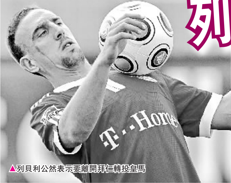
▲列貝利公然表示要離開拜仁轉投皇馬

比利時足總在官方聲明中稱，雙方已經正式簽署了合同，由於艾禾卡特與俄超勁旅的合同將在今