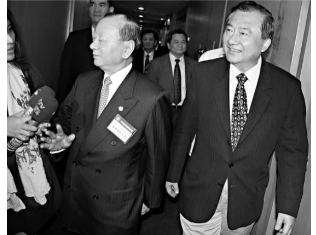
三日下午，台灣「經濟部長」尹啓銘（右）在台北出席台灣商總大會時表示，希望今年底明年初 ECFA 能簽下來。其左為台灣商業總會理事長張平沼

【本報訊】中新社台北三日消息：台灣「經濟部長」尹啓銘三日在此間表示，希望今年底明年初 ECFA（兩岸經濟合作架構）能簽下來。