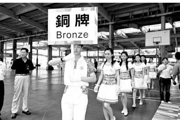
高雄世運頒獎服務隊排練三日登場，驗收訓練成果，志工首度身著世運頒獎志工作服裝排練，充滿濃濃客家風（中央社）

據了解，除組織鄉鎮民意代表團赴閩考察外，該協會還將分期組織對大陸理解不夠、理念不清晰的鄉鎮長赴大陸考察，爭取兩年內讓全台灣的三百一十九個鄉鎮正副職