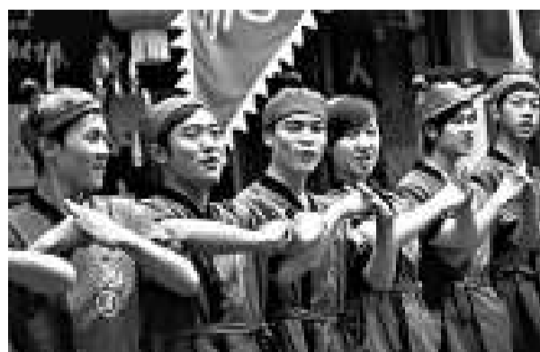
成都武俠餐館開業，服務員古裝打扮迎客

消息人士表示，整個國慶慶典的總人數可能會將近50到60萬人，與此同時，國慶節當晚的焰火晚會，參加人數也在10萬以上，再加上多個分會場的煙火燃放、國慶長假期間的遊園活動，京城屆時將有數百萬人參與到國慶慶典中。