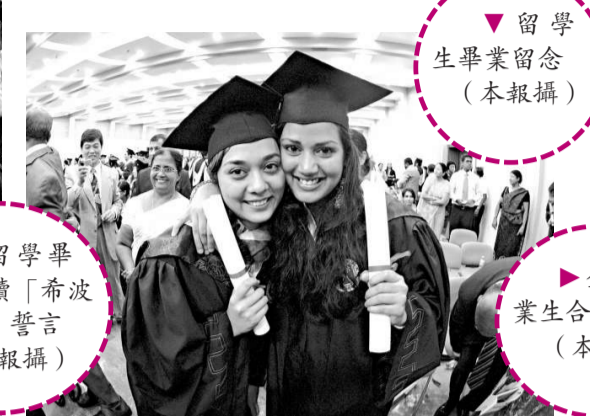
全體畢業生合影留念