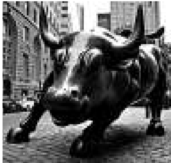
美國華爾街的金牛 (互聯網)

據透露，與華爾街金牛不同的是，外灘金融廣場的金牛將以中國牛為原型設計。目前，雕塑正在製作過程中，預計在半年結束之前便能正式落戶外灘。