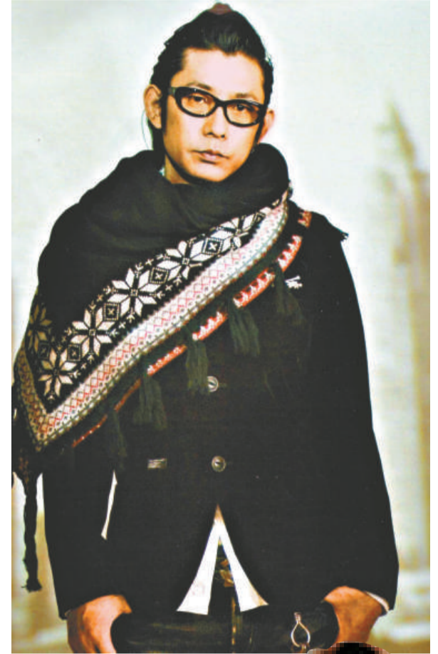
▲永瀨正敏(右)當司機管接送，而川村亞紀則坐於中島美嘉昔日的「指定座位」▲永瀨正敏當年拍攝劇集《私立偵探》，想不到與劇中的多位女星結緣

永瀨與川村在二〇〇二年合演過劇集《私立偵探》，無獨有偶，他亦分別與前妻小泉今日子和前女友中島在此劇中合作過。報道指，永瀨駕車與川村一同到東京一咖啡店，和《私》劇的合演者聚餐，而有分演出的小泉與中島均告缺席。眾人談天說地四小時後，已是凌晨二時，永瀨與川村離開，兩人步向停車場時，一直有說有笑，之後川村坐在中島昔日的「指定座位」——永瀨座駕的前座，兩人遊車河之後，車子再向永瀨的家方向前進。永瀨的事務所表示，川村乃是永瀨的朋友，因為永瀨沒有飲酒，所以充當司機，駕車接載朋友而已。至於川村的事務所，則解釋說《私》劇的演員不時亦相約見面，永瀨一向對後輩照顧有加，川村只是其中之一。