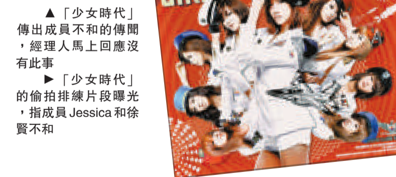
▲「少女時代」傳出成員不和的傳聞，經理人馬上回應沒有此事▲「少女時代」的偷拍排練片段曝光，指成員 Jessica 和徐賢不和

偶像組合「少女時代」近來新聞多多，早前她們被韓國某網站上載一段偷拍片段，當中成員 Jessica 在排練過程中推撞另一位成員徐賢，雖然片段沒有聲音，但從畫面估計，當時 Jessica 應該在責罵徐賢。「少女時代」的經理人就片段回應，指當時 Jessica 不是罵徐賢，並強調各成員感情要好，不會有不和的情況。