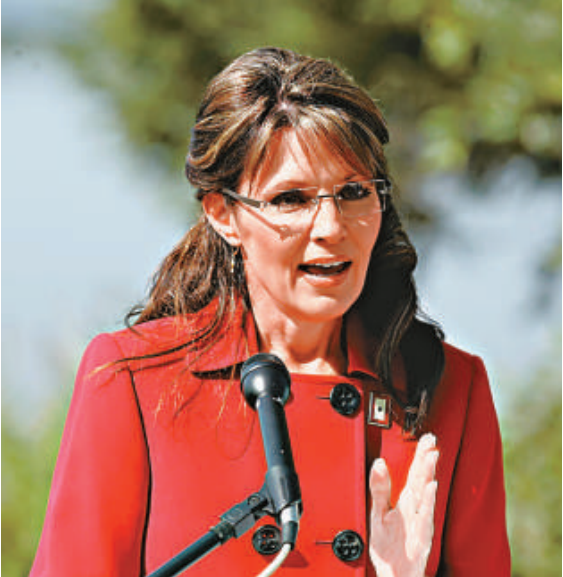
阿拉斯加州州長佩林三日宣布，她將於七月底辭去州長職務

佩林選擇此時辭職，可以擺脫阿州日常州務的纏繞，全身心投入到共和黨的全國政治舞台上，她可以利用為共和黨籌款以及為候選人助選等方式，提高曝光率和知名度，並藉機加強對全國政治經濟事務的了解和認識，同時提高國際視野，加強在國際事務上的磨練，為二〇一二年總統選舉做足準備。而她的辭職，為她的副手帕內爾提前向選民展現自己的能力提供了更大的舞台和機會，使阿州州長一職繼續掌握在共和黨手裡。