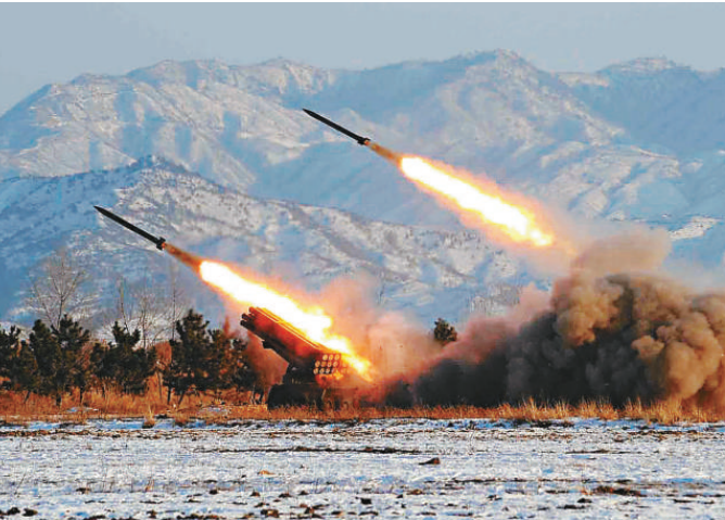
朝鮮發射短程導彈的情形（資料圖片）