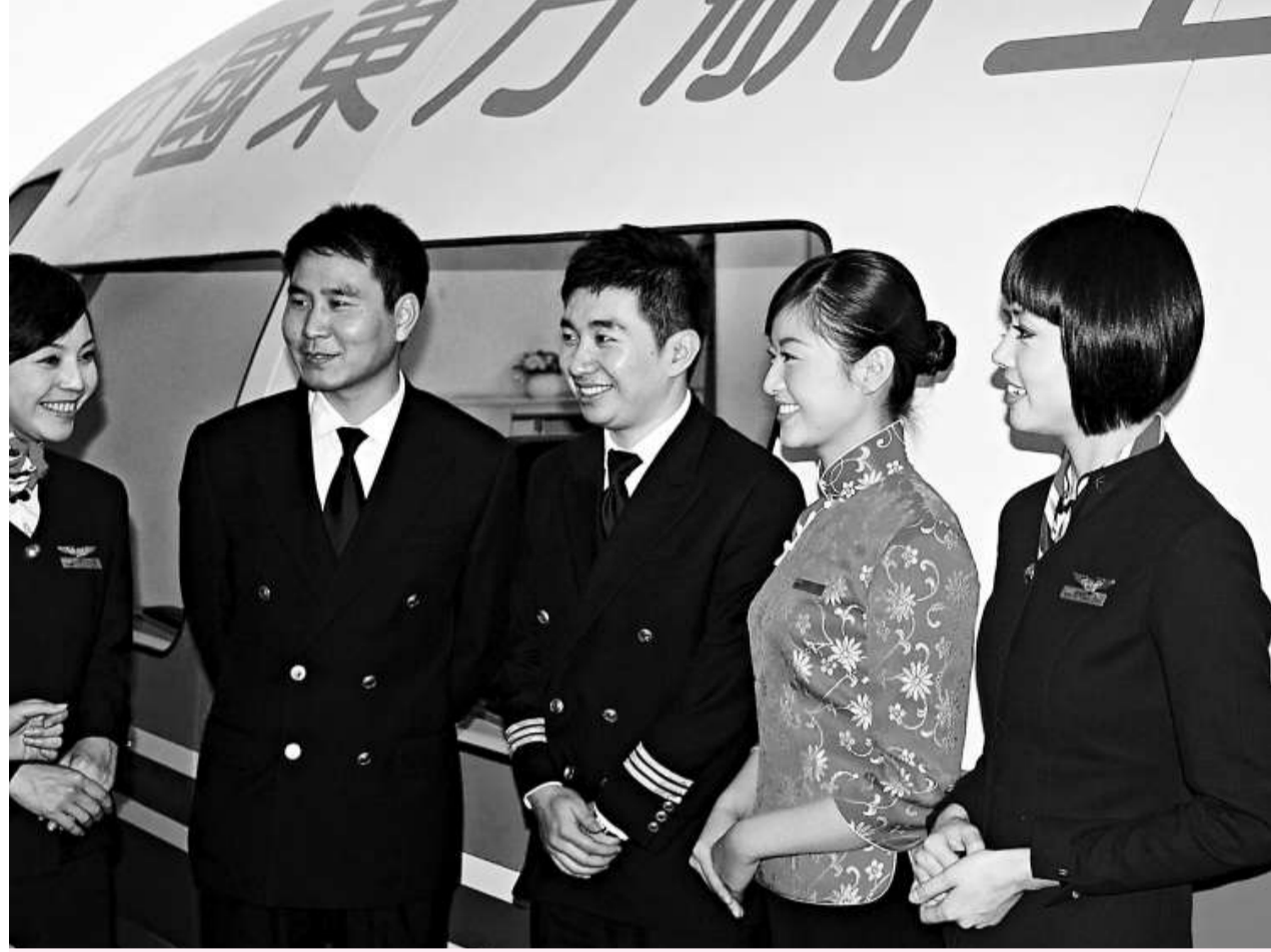
大陸提議開放海峽中線以解決航線飽和狀況，卻意外觸動了「台灣安全敏感神經」，相比之下，兩岸實現「裁彎取直」直航時雙方達到了皆大歡喜的效應 (資料圖片)

海峽中線是兩岸之間靠默契維繫的空中界線。美國軍方印製的「作戰航圖」，在台海上空標定一條「大陸沿岸緩衝區」邊線，警告「凡誤入本空域之航空器可能在無預警狀況下遭防空火炮射擊」，該概念日後逐步演變成「海