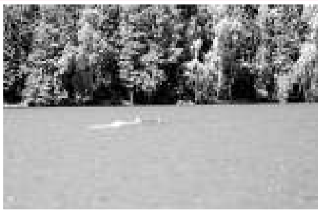
▲遊客在喀納斯湖一湖灣拍攝的「湖怪」照片

國家林業局和財政部從去年開始，將西藏等四個省區列為野生動物肇事補償試點，由中央安排專項資金開展試點，採取由中央財政補助，地方具體實施補償的辦法，着手對野生動物造成的人畜傷害和損毀作物問題開展補償工作。