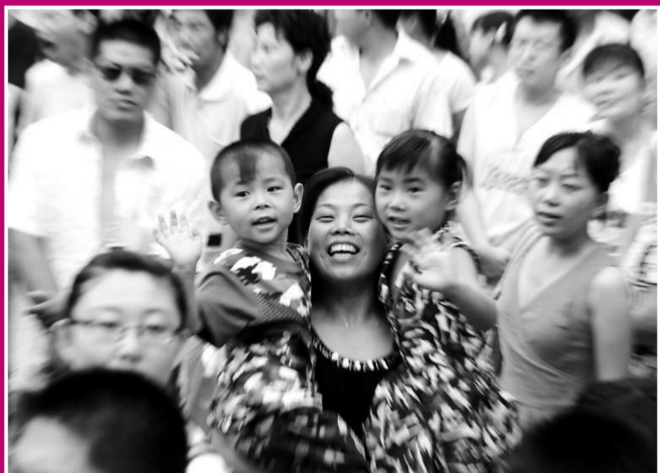
雙胞胎大聚會 山西省太原市5日舉辦「雙胞胎文化節」，近300對雙胞胎聚集在迎澤公園，共同分享成長的快樂。圖為一位母親抱着龍鳳胎兒女參加文化節。