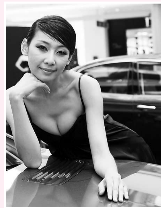
名車名模爭艷 5日，在上海恒隆廣場舉行的頂級名車展，模特兒的性感助陣吸引不少觀眾目光。

此次「機鋒·辯·禪」還邀請了紹雲禪師、本如法師、楊曾文教授、何建明教授等爲特邀嘉賓。並擬邀請中國佛教協會副會長、北京佛教協會會長傅印長老作辯論評委。