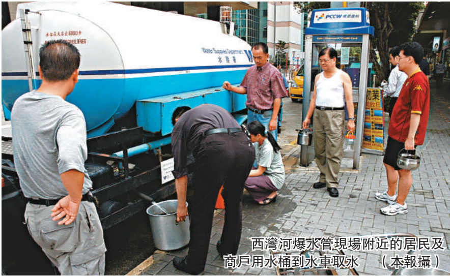
西灣河爆水管現場附近的居民及商戶用水桶到水車取水