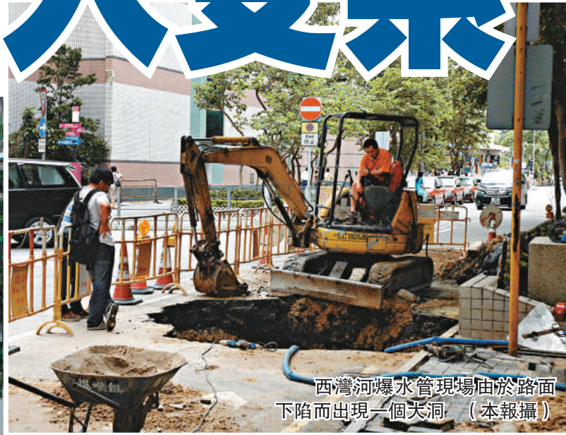
西灣河爆水管現場由於路面下陷而出現一個大洞。（本報攝）