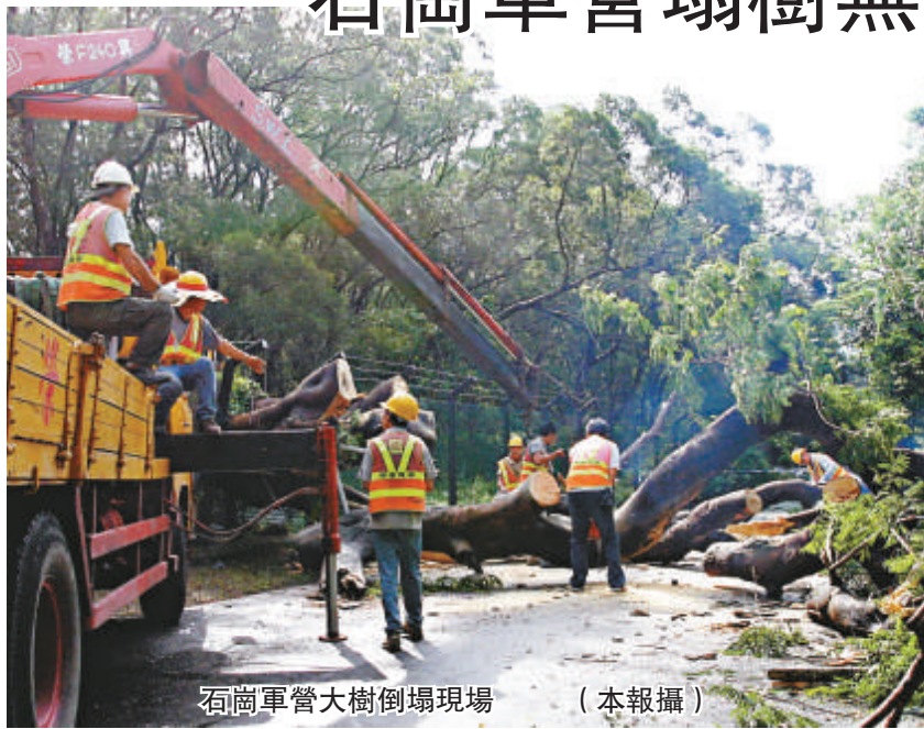
石崗軍營大樹倒塌現場

【本報訊】石崗軍營內一棵十多米高的大樹昨日清晨疑不敵暴風雨吹襲，突然連根拔起塌下壓毀軍營鐵絲網，打橫阻礙馬路，幸無人受傷。消防員到場將馬路封閉，動用電鋸將樹切斷移走。