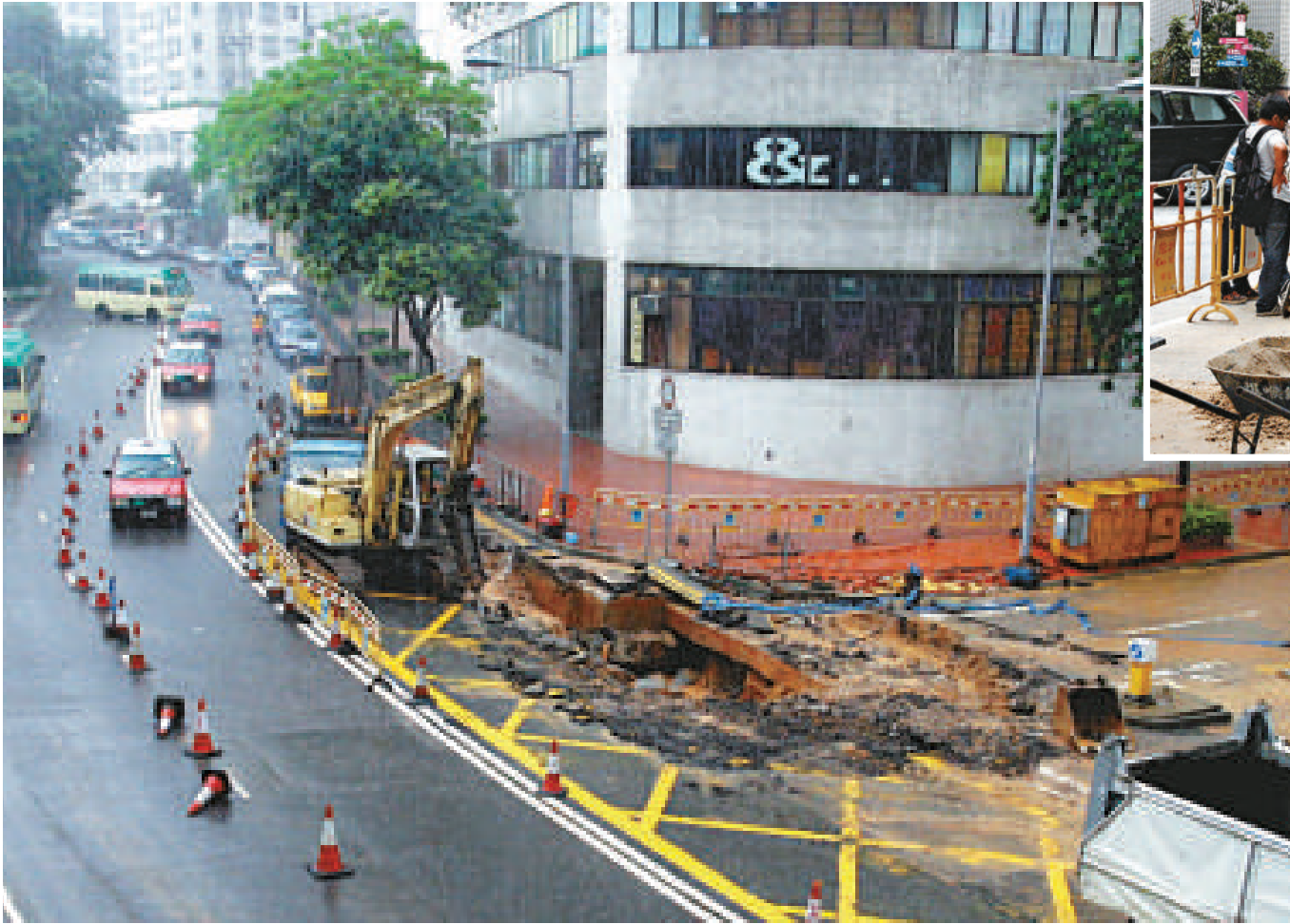
▲荃灣西樓角路昨晨突然水管爆裂，大量食水及鹹水湧出「迫爆」路面

水務署派員到場關水掣及搶修，並安排兩部水車到場，為有需要市民供應食水；昨晨有受影響商戶派人用水桶取水回舖，才能繼續做生意。維修工程在下午三時許完成，受事件影響，警員曾將通往西灣河海濱公園的兩條行車線封閉，車輛需改道而行，包括2號及270號兩條巴士線一度臨時改道。