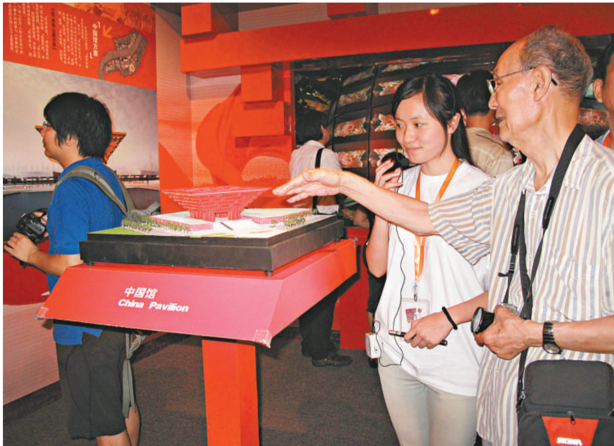
上海世博會「中國館」的模型引來最多觀眾關注

業內人士認為，24小時對點住宿安排對客人是一種方便，也可以看作是國際慣例下酒店對客人的一項增值服務。