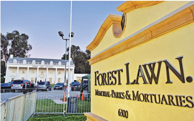
▲米高家人將在荷里活山的Forest Lawn墓園為米高舉行一個私人喪禮

《紐約每日新聞》引述追悼會監製埃利希（Ken Ehrlich）說，會有多名藝人獻唱，但並非是電視綜藝節目的形式，而是一個真正的悼念活動，主辦單位只想保持低調。