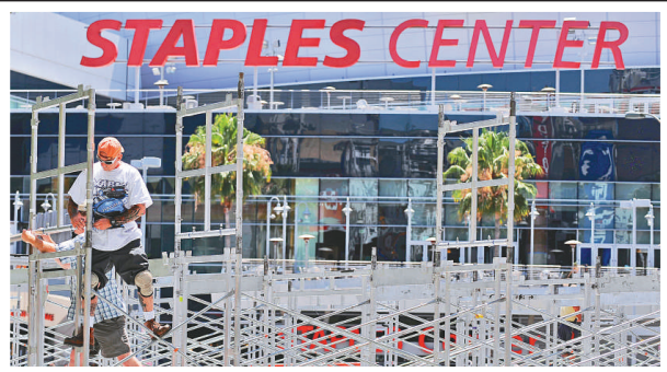
斯特普爾斯中心外，工作人員忙碌地為追悼會做準備

凡是被人塗污或損壞了的腕帶一概無效。所有入場券和腕帶不能轉售。不過，抽籤結果公布後，craigslist網站迅速出現數十個廣告，聲稱有入場券出售。其中eBay拍賣網更有人叫價二百至五百美元。