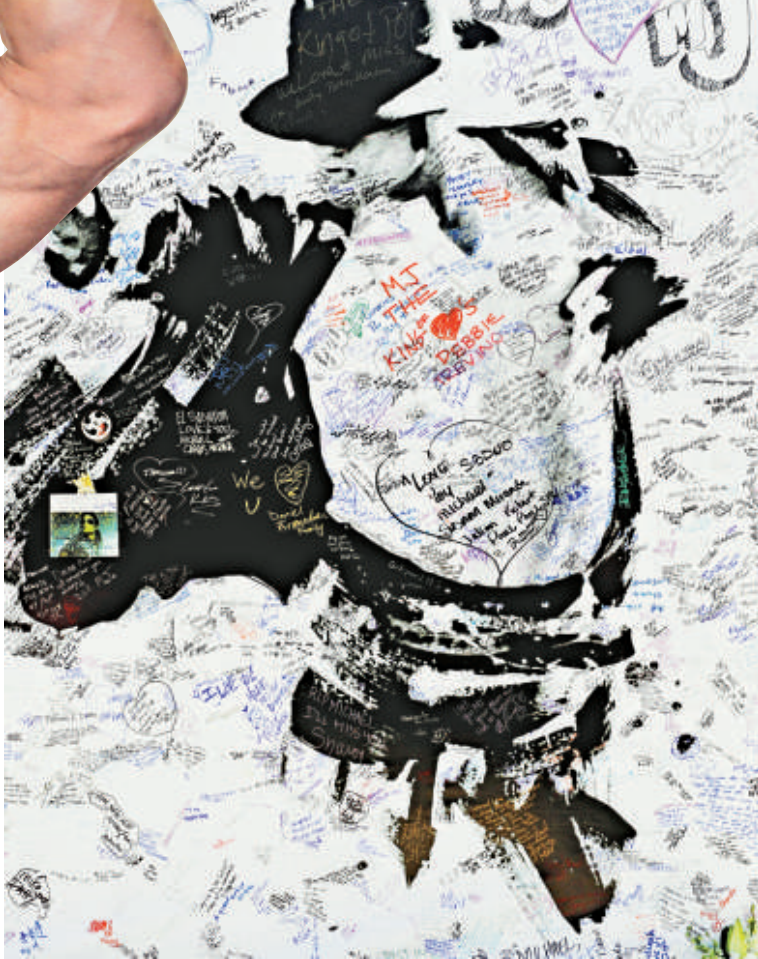
▲歌迷用以悼念米高的簽字板