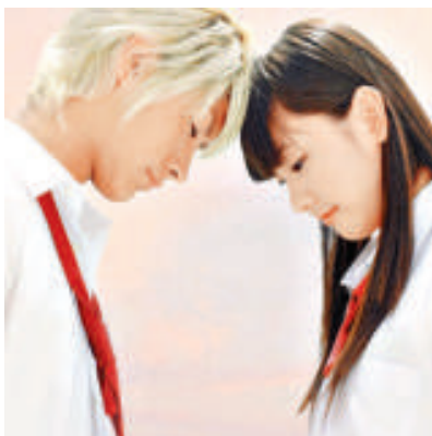
▲新垣（右）與三浦曾在電影《戀空》中合作

除了TBS的節目外，朝日電視台的《TV朝藝能Side》過去亦曾兩度報道類似的消息，所謂「空穴來風，未必無因」，相信一眾狗仔隊可能已經把鏡頭對準兩人了。