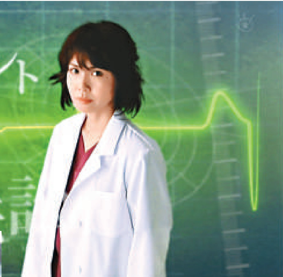
▲有傳菜菜子以半價接拍新劇