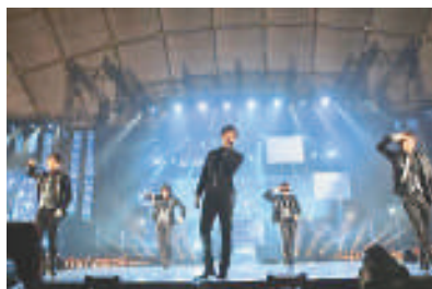
▲「東方神起」現時的日語絕對唔失禮 ▶「東方神起」在東京巨蛋開騷償願