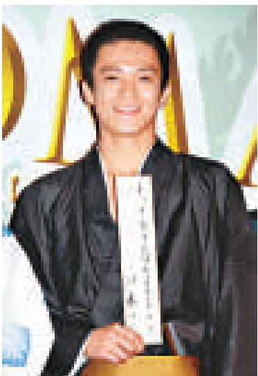
▲小栗旬於七夕節祈願，希望在精神上得到自由 ▶井川遙初為人母，愛女趕在她生日前出世

當日眾演員又為七夕祈願，小栗旬語重心長地表示：「我希望能夠變得更加自由。現時的自由並不是真正的自由，我想在精神上得到解放。」早前有報道指，小栗旬的女友山田優經常管束他，難道小栗旬想要從山田的手上得到解放？