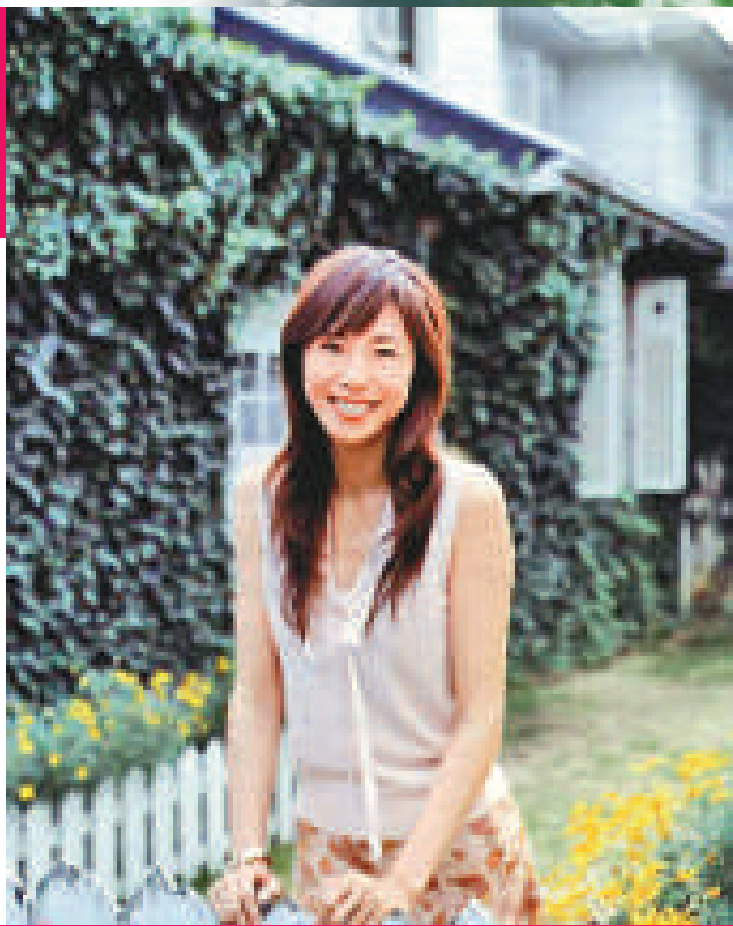
▲菜菜子將主演四集特別版《急症室24小時》 ▲江口車禍受傷，變相使菜菜子有更多曝光機會