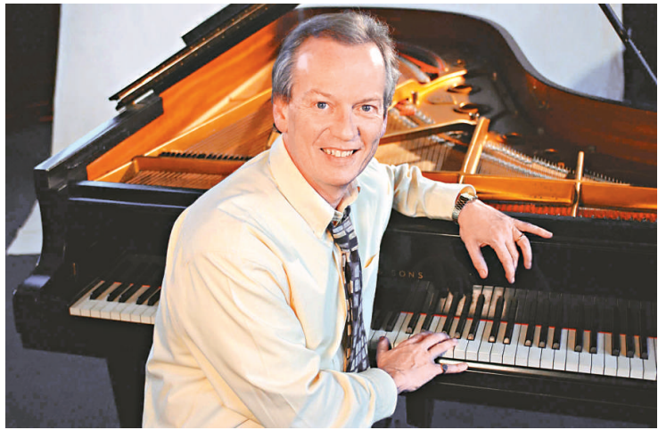
▲英國指揮及鋼琴家謝利