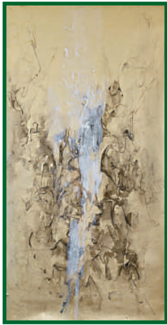
▲《無題》，紙上綜合材料，一九九二年