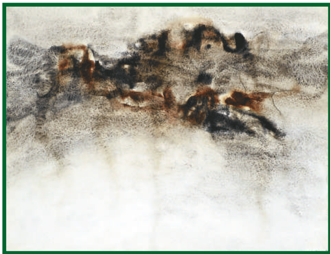
▲《無題》，紙上綜合材料，1966年 ▲《無題》，紙上綜合材料，1992年