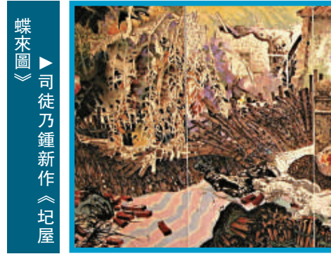
▲司徒乃鍾新作《圮屋蝶來圖》