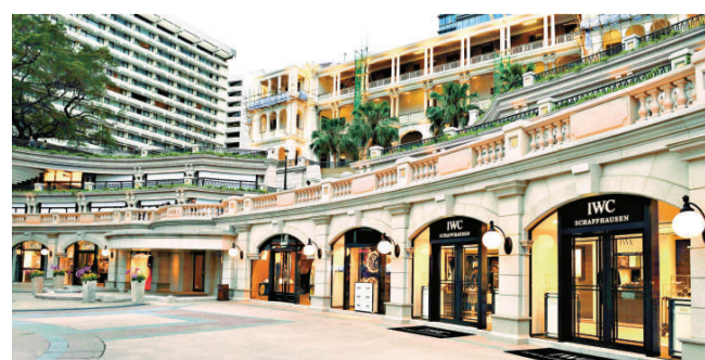
「1881」匯聚世界級品牌，大部份名店均以旗艦店形式經營