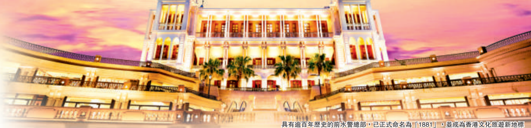
具有逾百年歷史的前水警總部，已正式命名為「1881」，並成為香港文化旅遊新地標