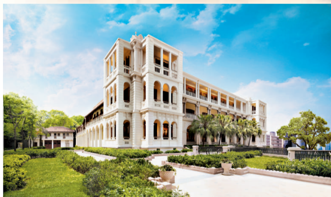
「1881」為香港碩果僅存之殖民地建築，並被評定為香港法定古蹟

逾10億港元，無論工程規模、複雜程度、資金投入均相當浩大。整個項目的歷史建築復修工作以國際標準規格進行，邀請不同範疇的專家參與，如建築師、歷史建築物保育專家、專業設計師、樹木專家、園藝師及工程監督等。設計師更特別參照主樓維多利亞式建築的特色設計新翼部分，令新舊建築融合，進一步提升整體建築物的美感。