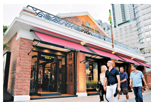
「1881」勢必成為旅客購物消閒熱點