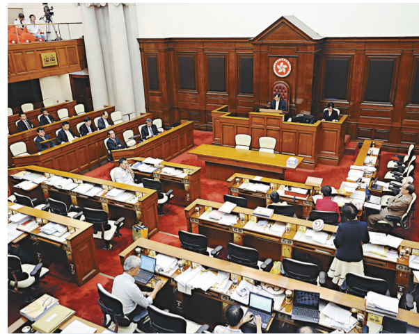
經過辯論後，反對派提出的「正視七一遊行訴求」動議被否決

唐英年強調，這個目標和責任，必須由特區政府和立法會去共同努力，共同承擔。他期望與立法會本着求同存異的精神，與廣大市民一起，建成二〇一二年的中途站。政府將於今年第四季開展有關二〇一二年選舉安排的公眾諮詢，唐英年重申，政府不會建議於二〇一二年落實行政長官及立法會普選，因為這並不符合人大常委會的決定。