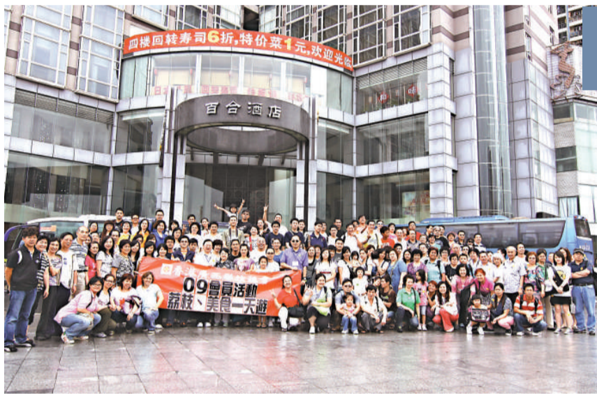
▲參加一天遊的團員合照留念