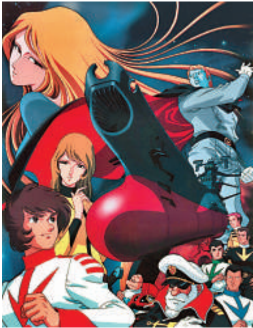
▲《宇宙戰艦大和號》的電影版權終於落實 ▶有傳澤尻英龍華將會成為《宇宙戰艦大和號》的女主角

澤尻出嫁之後，一直跟着丈夫周遊列國，雖然多次傳出她復工的消息，但她看來仍然樂不思蜀，無意回日本工作。當然，如果對手是木村的話，或許又另作別論，究竟《大和號》有何卡士，實在叫人拭目以待。