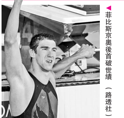
▲菲比斯京奧後首破世績

【本報訊】據美國十日消息：在美國游泳錦標賽男子100米蝶泳決賽中，美國名將菲比斯輕鬆奪冠，並以50秒22的成績打破了該項目的世界紀錄（比舊紀錄快0.18秒）。這也是菲比斯自奧運會結束後首次打破世界紀錄。