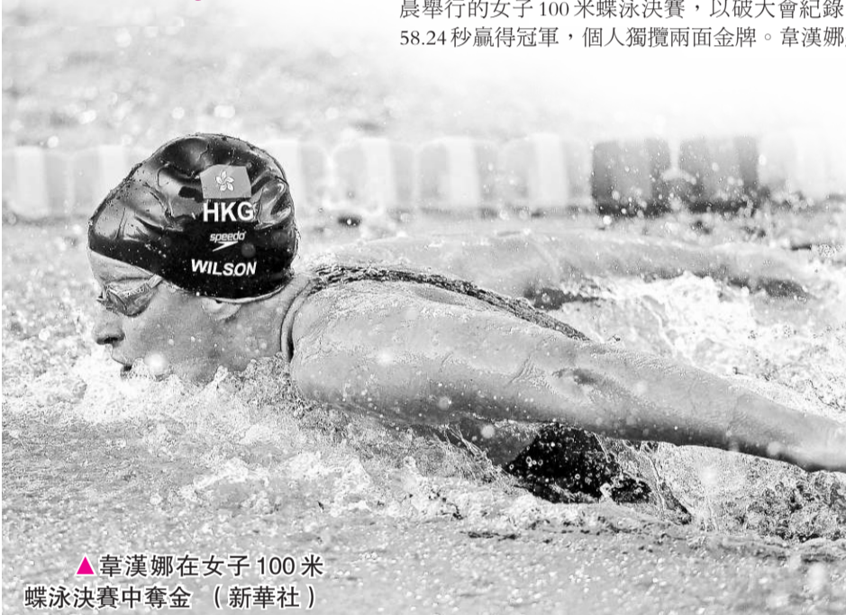
▲韋漢娜在女子100米蝶泳決賽中奪金

【本報訊】港隊於貝爾格萊德舉行的第25屆世界大學生運動會再摘1金！早前在100米自由泳為港奪首冠的女泳手韋漢娜，在香港時間昨日凌晨舉行的女子100米蝶泳決賽，以破大會紀錄的58.24秒贏得冠軍，個人獨攬兩面金牌。韋漢娜將