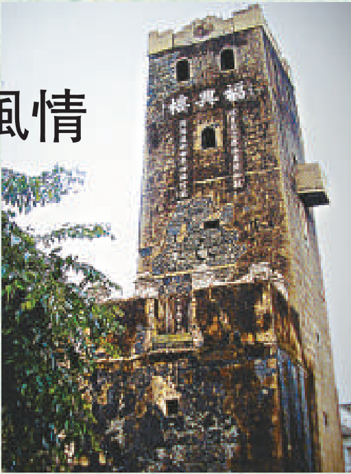
飽經滄桑的塔式古堡福興樓

蘭州歷史上即「煙雨皋蘭」清涼之地，蘭州取得「絲路夏宮」的美譽，既有其得天獨厚的地理、自然、生態、氣候因素，也是蘭州市重視環保、生態建設、大力建設循環經濟城市、改善和諧城市人居環境的結果。