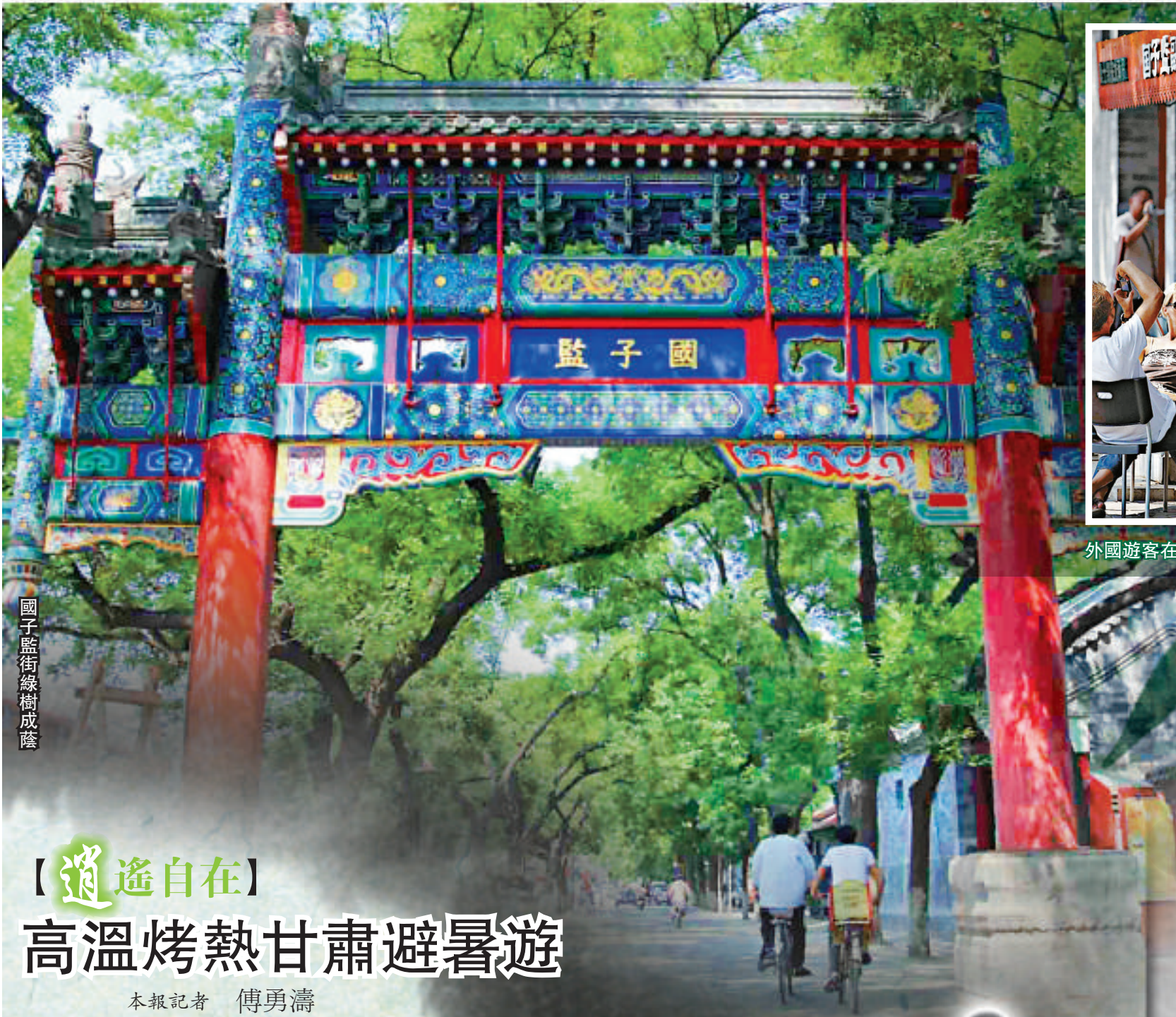
國子監街綠樹成蔭