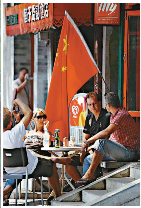
外國遊客在國子監街休息納涼，感受京韻

旅遊TIPS： 海博會19至20日為公眾開放日，現場免費領取門票，為方便觀眾前往觀看企鵝，珠海市政府在拱北口岸、香洲、吉大設立專線巴士接載遊客，來回車費15元。