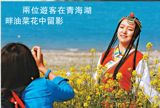
兩位遊客在青海湖 畔油菜花中留影

今年，蘭州市政府計劃投資120億元在皋蘭什川打造「蘭州夏宮」，而蘭州市今年再登「中