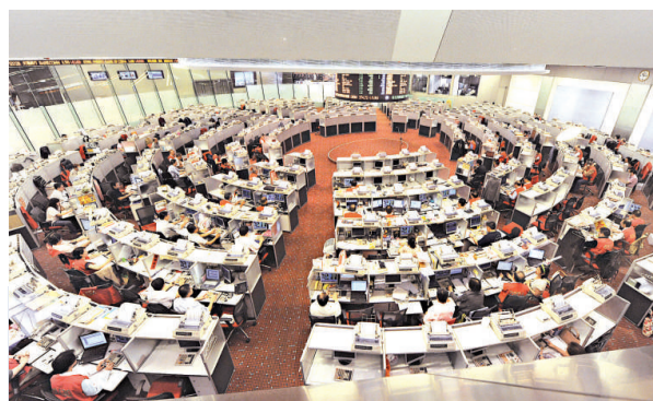
儘管港股短期仍然缺乏方向，惟新股熱潮暫未降溫

另外，內地第四大空調品牌志高控股(00449)亦於今天掛牌，市前暗盤價高見2.87元，較招股價高逾26%。新股上市陸續有來，市傳內地房產商寶龍集團已重新啓動招股計劃，美國拉斯維加斯金沙集團亦有意分拆澳門業務來港上市。