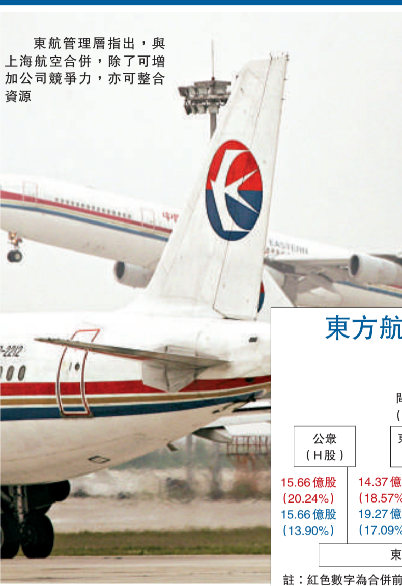
東航管理層指出，與上海航空合併，除了可增加公司競爭力，亦可整合資源

東航透過是次增發A股及H股，額外集資約70.2億元。管理層指出，環球經濟面臨衰退，內地經濟增速亦有所放緩，即使東航最近獲注資70億元，惟預期資產負債率仍然高企，淨資產更錄得負數，基於經營及財務狀況面臨沉重壓力，增發股份集資將有助提高公司競爭力，並有助改善經營狀況。