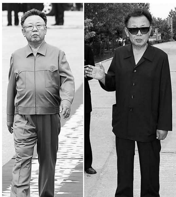
金正日2007年(左)與2009年(右)照片對比

【本報訊】據中通社十三日報道：韓國傳媒引述消息指，朝鮮最高領導人金正日罹患胰臟癌，病情嚴重，性命垂危。