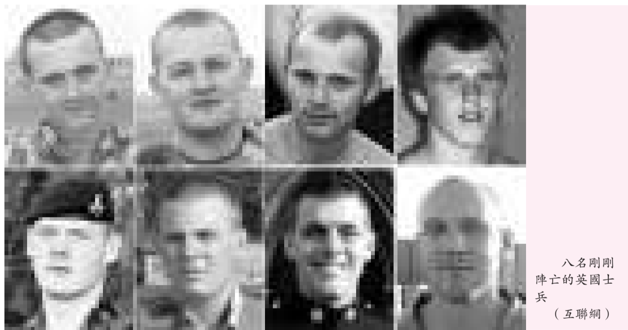
八名剛剛陣亡的英國士兵

預料將有數百人來到唐寧街外面，參加「停止戰爭聯盟」十三日倉卒安排的抗議活動，另一方面，國防大臣艾思和將會就阿富汗戰爭問題面對國會議員的質詢。