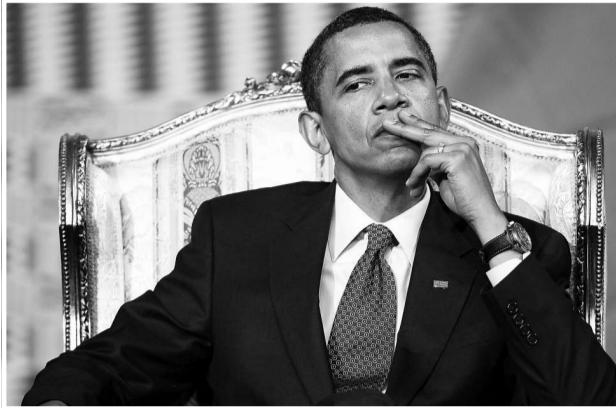
▲美國總統奧巴馬 (資料圖片)

根據一九四七年的《國家安全法》，總統須確保參衆兩院情報委員會「充分且即時」掌握重大情報活動資訊。該法也明訂，關於必須掩飾國家角色的情報活動，簡報對象可以限縮於國會朝野領袖、情報委員會主席等所謂的「八人幫」。