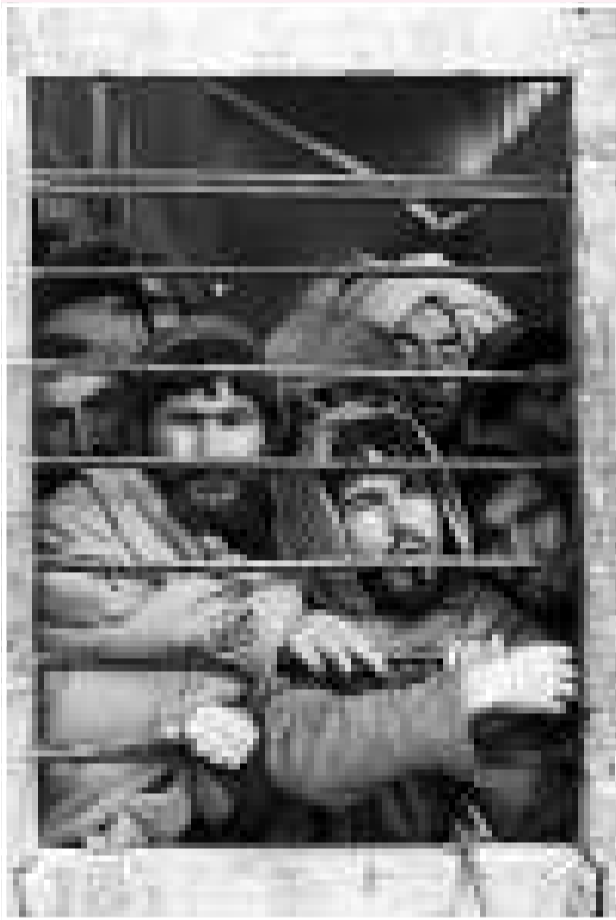
▼被關押在監獄的塔利班戰俘