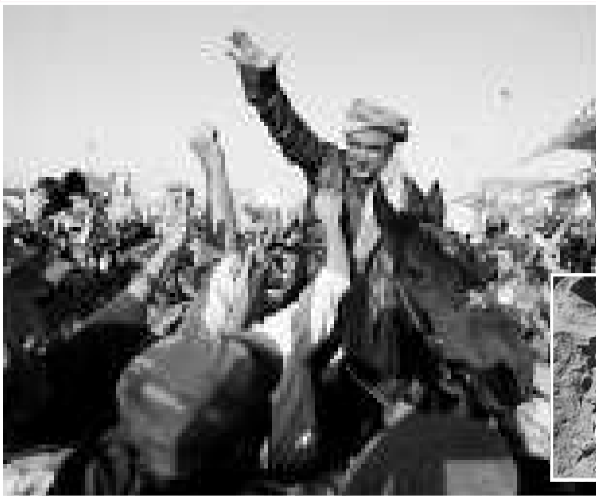
▲被指應對戰俘死亡負責的阿富汗軍閥杜斯塔姆(中)