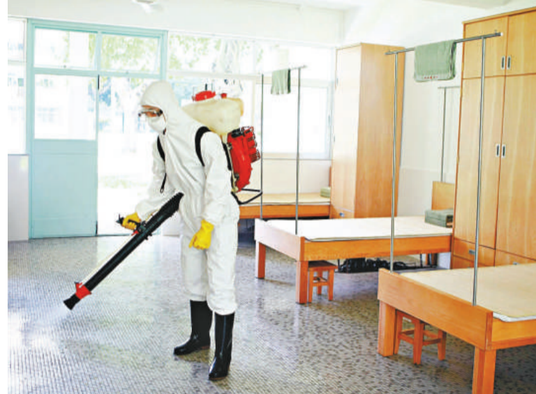
▲針對目前甲型H1N1流感疫情，駐香港部隊採取了一系列措施來確保學員們的健康和安全，加強了軍營內的消毒防疫。