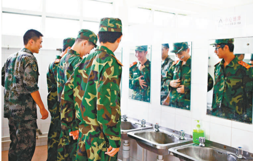
▲200名香港中學生將在爲期15天的軍營生活中，學習掌握軍隊基本知識和優良傳統，進一步增強國家和民族意識。

針對目前H1N1型流感疫情，駐香港部隊採取了一系列措施來確保學員們的健康和安全。譬如，加強了軍營內的消毒防疫，配備充足的清洗消毒設備和用品，對訓練、住宿和用餐環境進行了認真的檢查、清潔，並安排專人負責廚師的體檢和食品衛生檢驗。同時，駐香港部隊的醫護人員還將配合夏令營籌委會派駐的港方醫生，負責學員的醫療保障等。「香港青少年軍事夏令營」自2005年首度舉辦以來，已成功舉辦了四屆，共培訓香港中學生650名。香港軍事夏令營的成功舉辦，增進了駐香港部隊官兵和香港學生之間的溝通與交流，受到了香港社會各界的廣泛關注和高度評價。