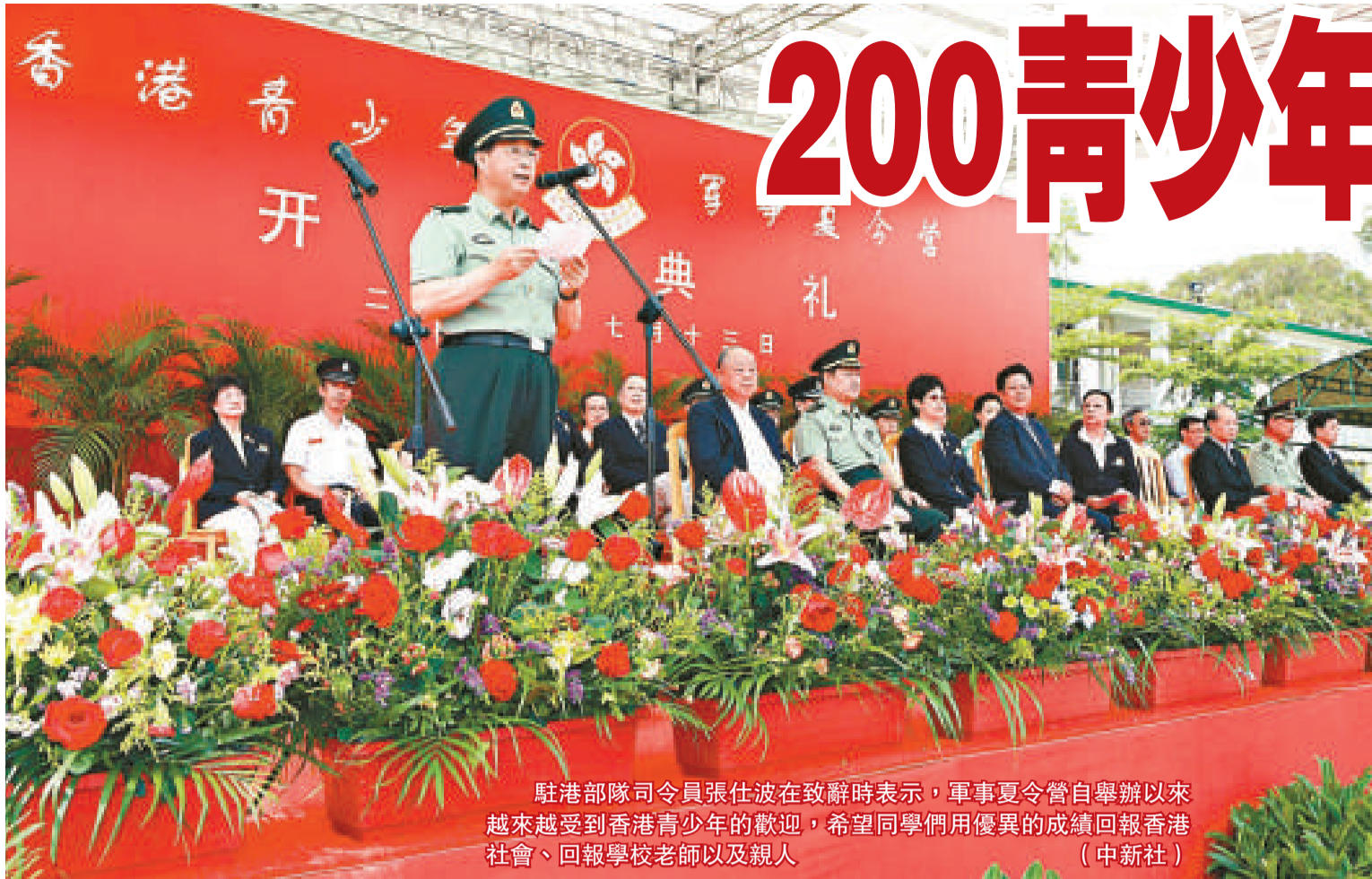
駐港部隊司令員張仕波在致辭時表示，軍事夏令營自舉辦以來越來越受到香港青少年的歡迎，希望同學們用優異的成績回報香港社會、回報學校老師以及親人。