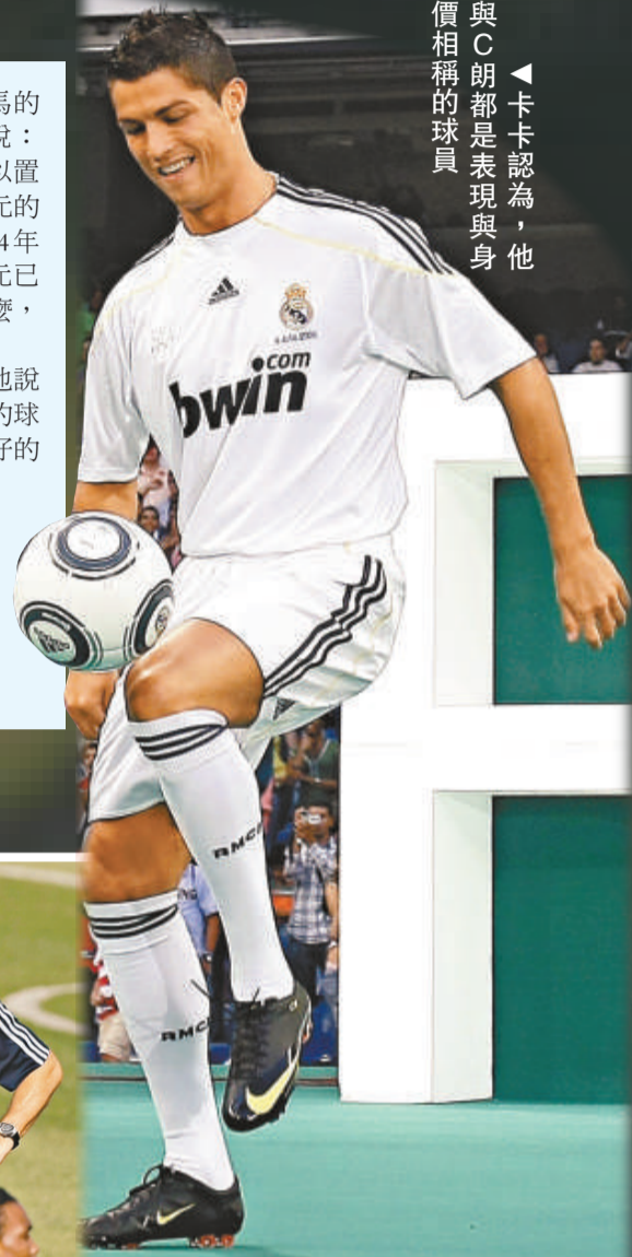
與C朗都是表現與身價相稱的球員

究竟皇馬的揮金如土能否獲得相應的回報還要等新一代「銀河戰艦」在新賽季中的表現。8月底新賽季西甲聯賽就將拉開序幕，皇馬將在首場比賽中主場迎戰拉科魯尼亞。