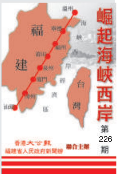
崛起海峽西岸 第 226 期

福廈鐵路預計今年十一月底開通貨車，明年春節開通客運。屆時福州至廈門只需一個半小時。此前於六月三十日通車的溫福鐵路，全長二百九十八點四公里。該路段客運列車將於十月份正式投入運營。屆時從福州出發，四個小時可抵達杭州，六小時抵達上海。