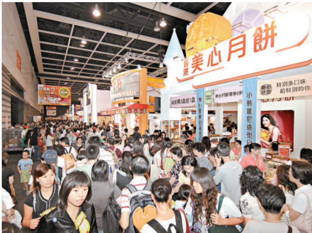
今年踏入二十周年的香港美食博覽，預計入場人次將打破去年三十一萬紀錄，圖為去年博覽現場（資料照片）

黃壽良表示，今次還將特別以生活水平較高和重視品味的人士、以及購買力強勁和渴望擁有高價值優質產品的內地中產消費者為推廣目標，因四大生活展的舉辦期適逢內地居民到港旅遊的旺季，同比去年八月便約有一百六十七萬內地客訪港；因此，貿發局已與香港旅發局、旅行社展開合作，尤其是與廣東超過十家旅行社合作組團，為歷來最大的組團規模，其中珠三角地區出發的旅行團團費