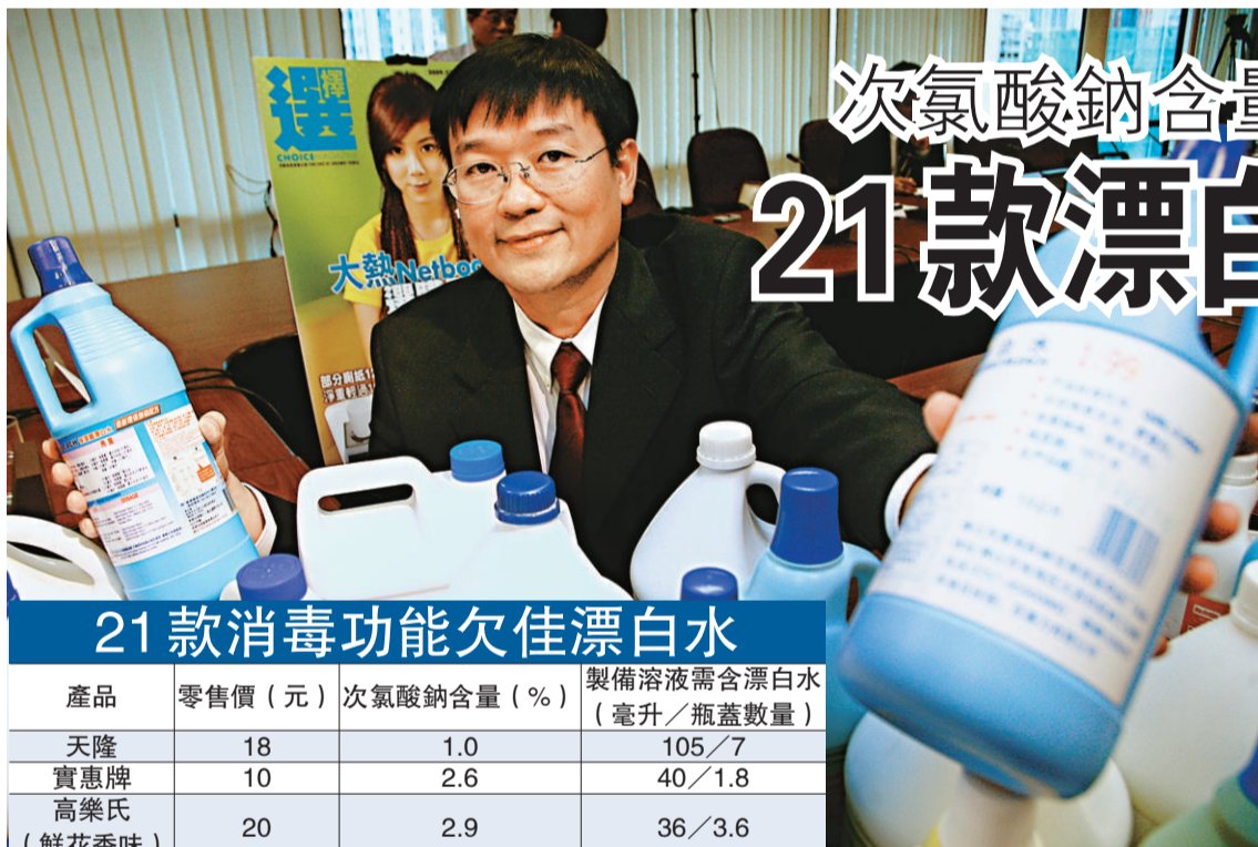
消委會發現，僅十六款漂白水有標示次氯酸鈉含量