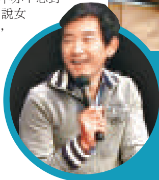
▲石田純一越洋發送傳真，承認與女高球手東尾理子（圖）的戀情

現時石田正身在海外工作，他會在回國後正式開記者會交代事件。他在傳真中亦不忘對女友表示關心，說女友很重視獎項，最近她有比賽，希望傳媒不要打擾她，讓她專心作賽。看來石田公開戀情，是希望為女友擋駕，認真細心。