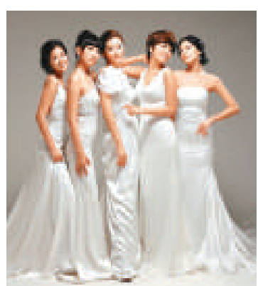
新進少女組合「LPG」模仿孫淡妃，向她致敬

新進女子組合「LPG」，最近出席電視節目時，五位成員紛紛模仿性感歌手孫淡妃的造型，並唱出她的主打歌《瘋了》。「LPG」表示本身很欣賞孫淡妃，而孫淡妃早前更特別送了五套她登台穿過的衣服給「LPG」成員。「LPG」對孫淡妃深表謝意，並表明會繼續努力，希望能創出一番好成績。