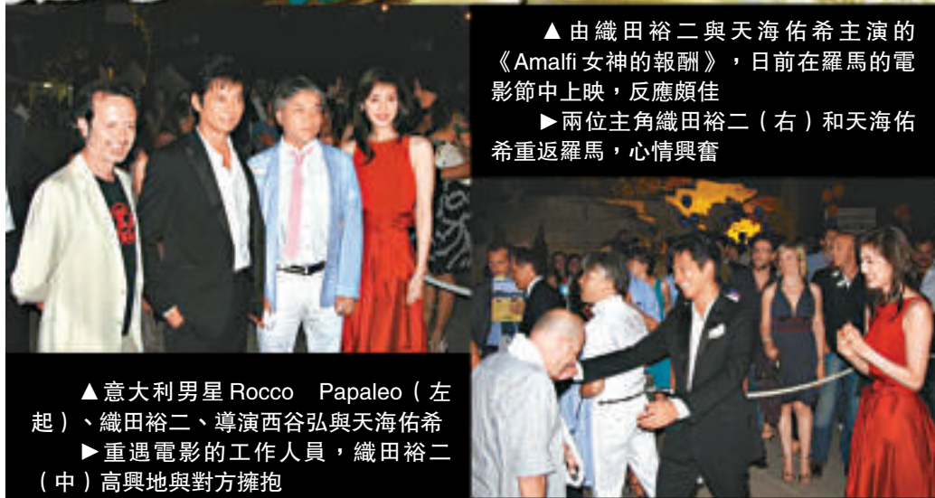
▲由織田裕二與天海佑希主演的《Amalfi 女神的報酬》，日前在羅馬的電影節中上映，反應頗佳

織田與女主角天海佑希一同到羅馬出席電影節，電影在當地反應超出預期，天海表示使她增添了不少信心；而織田則信心十足，說《女神》為日本電影揭開了新的一頁，更期待會開拍續集。