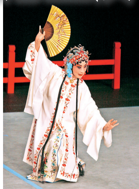
▲梅花獎得主鄧宛霞演出崑劇《艷陽樓》

演出於香港文化中心劇場舉行，詳情如下：八月二十一日及二十二日（星期五及六）晚上七時三十分，京劇《金玉奴》；八月二十三日（星期日）晚上七時三十分，折子戲專場——京劇《艷陽樓》、京劇《李逵探母》、崑劇《牡丹亭·尋夢·寫真》。門票於城市電腦售票網發售，查詢可電二二六八七三二五。