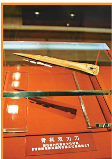
▲甘肅臨潭陳旗磨溝齊家文化墓出土的骨柄雙刃刀