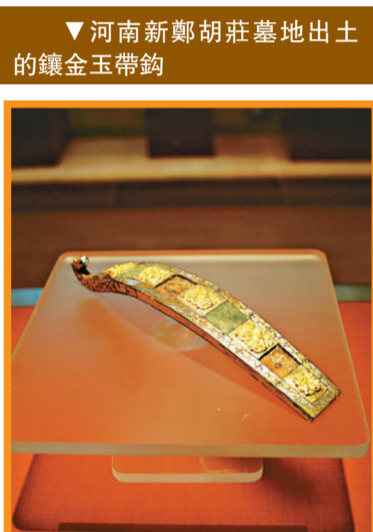
▼河南新鄭胡莊墓地出土的鑲金玉帶鈎