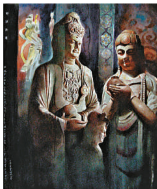
《挺起不屈的脊梁》田滄海畫作《世代觀音》