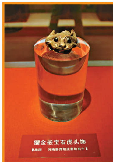
▲河南新鄭胡莊墓地出土的鍍金嵌寶石虎頭飾物