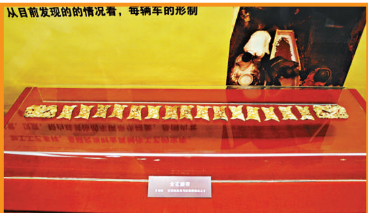
甘肅張家川馬家原墓地出土的金花腰帶

由國家文物局和杭州市人民政府共同主辦，中國文物報社和杭州歷史博物館承辦的「二〇〇八年度全國重要考古新發現成果展」，正在浙江杭州歷史博物館舉行，展出一批反映去年中國重要考古新發現的珍貴文物，為大家奉上歷史盛筵，展期至八月十三日。