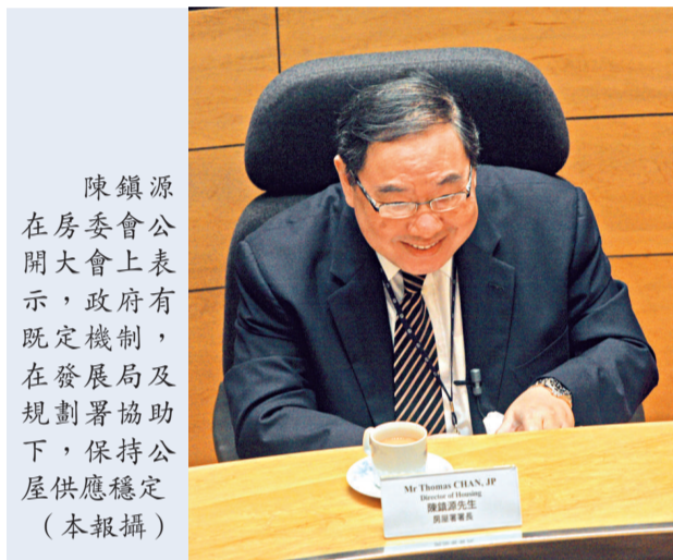
陳鎮源在房委會公開會上表示，政府有既定機制，在發展局及規劃署協助下，保持公屋供應穩定，在發展局及規劃署協助下，保持公屋供應穩定

公屋輪候申請人數持續上升，房屋署署長陳鎮源表示，土地資源有限，房委會爭取覓地建屋存在困難，經常遇到挑戰，但政府有機制保持公屋供應穩定，包括在新界東北新發展區及洪水橋新發展區，預留土地供發展公屋；房委會盡力將重建公屋地皮保留作公屋發展用途，確保履行公屋輪候人士三年上樓的承諾。房署並於五月巡查全港超過三十個屋邨，打擊濫用公屋問題，加快公屋流轉。