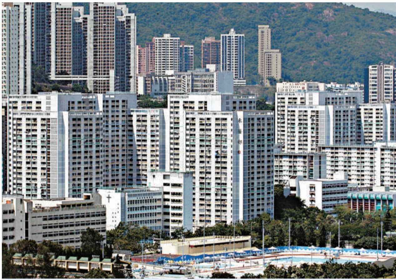
公屋輪候申請人數持續上升，但可以興建公屋的土地卻相當有限 (資料圖片)

萬戶公屋家庭，打擊濫用公屋問題。房屋署五月進行突擊巡查，在兩星期內，巡查三十一個屋邨共四十一座樓宇，訪問了七成八即大約二萬個家庭，並已將問題個案轉介調查。如發現違規個案，租戶可能會被終止租約。