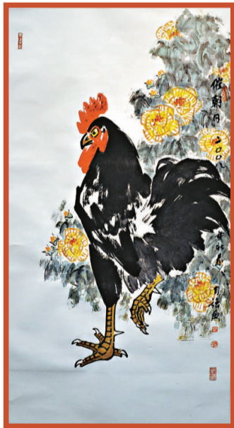
▶特邀作品《催朝日》 (李自強)