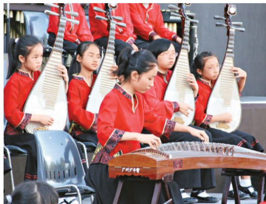
廣州少年宮民樂團在表演

【本報訊】記者袁秀賢廣州報導：廣州市少年宮少兒民族樂團、廣州市鐵一中學管樂團於日前同赴奧地利參加第三十八屆維也納國際青少年音樂節——「2009年青少年相聚維也納」，雙雙獲獎。廣州少年宮民樂團獲得金獎第一名，這是中國少兒民樂團在維也納獲得的最高獎項。