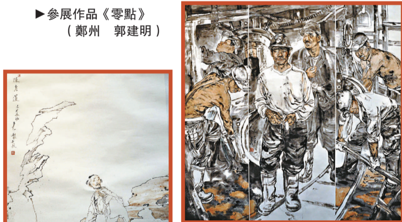
▶參展作品《零點》 (鄭州 郭建明)