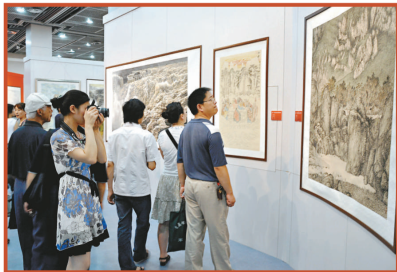
▲眾多民眾在參觀展覽