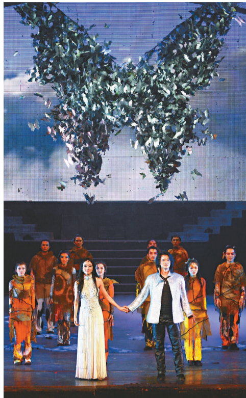
▲男女主角與眾演員謝幕