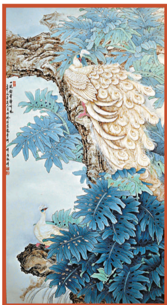
▶參展作品《一洗鉛華靜聽風》 (開封 尚淑婷)