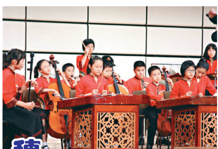
獲維也納青少年音樂節金獎的廣州少年宮民樂團