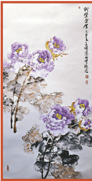
▶特邀作品《粉紫合金》 (王繡)