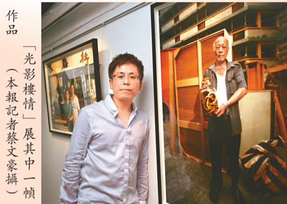
作品「光影樓情」展其中一幀

【本報訊】房屋委員會現於賽馬會創意藝術中心舉行「光影樓情」展覽，以圖片及錄像展示石硤尾邨、蘇屋邨及牛頭角下邨三個早期屋邨的環境面貌，以及居民之間的緊密鄰里情。