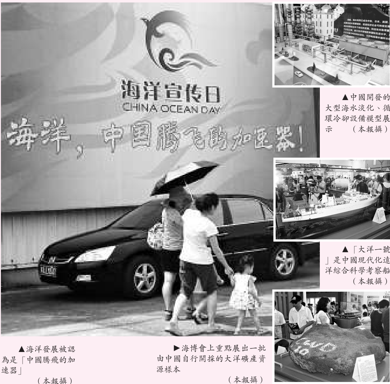
▲海洋發展被認為是「中國騰飛的加速器」

為進一步滿足大規模日常開發深海資源，中國正在加快開發研製涉重大裝備，其中中國海洋石油總公司便籌劃未來在深海建立「空間站」。周守為稱，這類深海「空間站」就像在太空一樣，潛水員衣服內有生命支持系統，能像太空人一樣在深海作業；而目前潛水員只能在三百至五百米水深進行正常作業。此外，應用於海洋開發與管理的海洋衛星系統已進入準業務化運行，其中「大洋漁場環境與漁情信息應用技術系統開發」、「衛星遙感大洋漁業高技術產業化示範工程」等重點項目已相繼獲國家科技部、發改委批准立項，將提高中國遠洋漁業的產業化效益，促進中國遠洋經濟可持續發展。