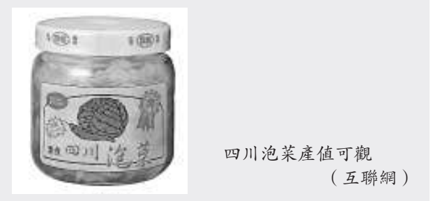
四川泡菜產值可觀

與會專家建議四川泡菜應避免各自為戰的鬆散狀態，發揮新繁、吉香居、味聚特等品牌企業的集聚效應，在申報「四川泡菜國家地理標誌」的基礎上，組建「四川泡菜集團」，建立完善的產品質量標準體系、安全監控體系，健全的營銷技術和營銷網絡，完善售後服務，加大人才培養，實行工業化生產模式，才能符合國際化的發展方向。