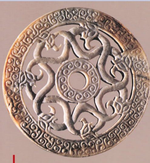
東周灰白玉透雕雲紋璣

2000年7月8日，時任河南省文物局局長常儉傳被通知前往時任河南省省長的李克強的辦公室彙報文物工作。李克強重點詢問了嵩山申遺。當李克強了解到當時嵩山申遺最大的困難是在世界文化遺產預備名單時，他立刻向常儉傳詢問解決困難的辦法。常儉傳說解決辦法有兩個，一是要中央領