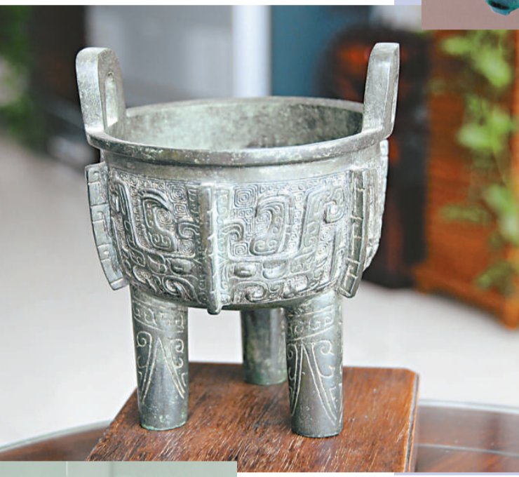
李克強贈送的圓鼎青銅器工藝品