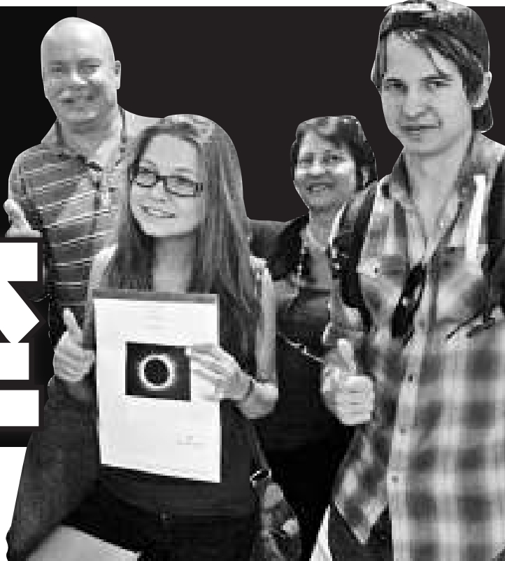
許多來自國外的天文愛好者均表示將通過此行更好地了解發展中的中國

另據中通社報道，由於台灣地區僅能看到日偏食，不少熱衷追日者近日也紛紛組團到大陸「朝聖」，台灣天文學界更是全體總動員，有媒體引述天文學者形容：「台灣能夠走路的天文學家都會到大陸去」。