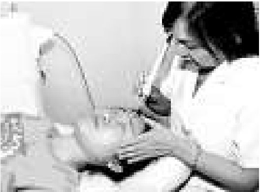
上海學子為獲取「求職分」大搞「面子工程」

在金融海嘯的衝擊下，上海大學生就業市場受到了不同程度的影響，不少敢於「豁出去」的應屆畢業生不惜代價在臉上動刀。記者從位於上海市中心的某家整形專科醫院了解到，每年假期都是學生整形的高峰期，今年前來諮詢整形事宜的學生人數較去年又增長不少，男同學的整形比例亦直線上升。