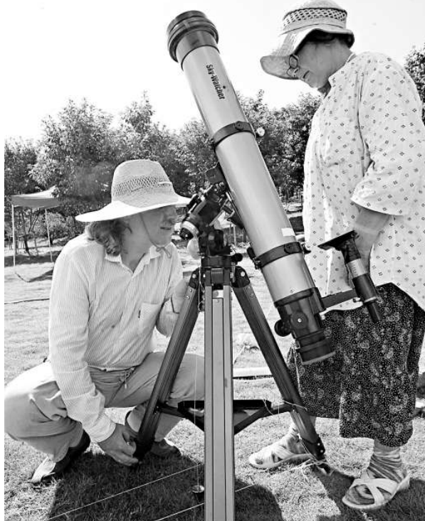
20日，來自俄羅斯的天文學家在蘇州調試日全食觀測設備