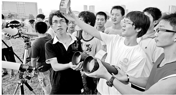
在安徽合肥，中國科技大學的學生向天文愛好者講解日全食的觀察方法