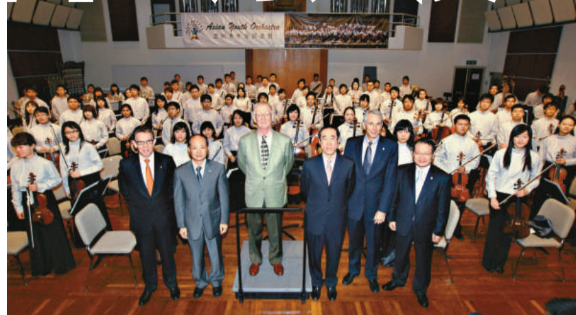
眾嘉賓主持亞青揭幕禮