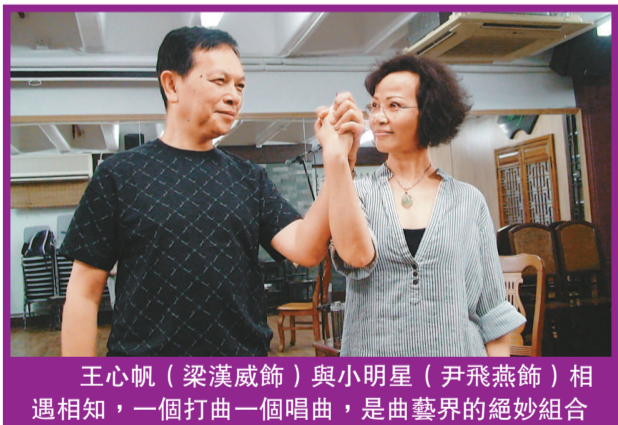
王心帆（梁漢威飾）與小明星（尹飛燕飾）相遇相知，一個打曲一個唱曲，是曲藝界的絕妙組合

如果要為廣東曲藝史上推舉一雙曲藝的絕配，王心帆與小明星肯定當之無愧，其他組合根本無法望其項背。據王心帆親述，他打「編撰」的曲，最通宜交給小明星唱，而小明星亦最通宜唱他的曲。這句話幾幾總結了這對搭檔是如何魚水相濟。