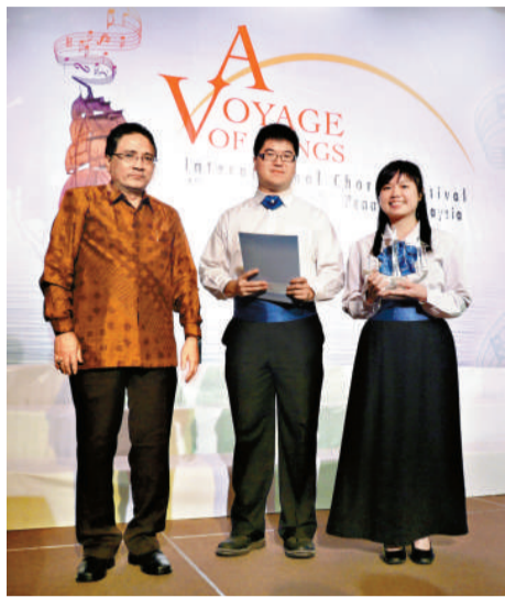
合唱團參加檳城國際合唱節比賽，合唱團代表接受大會頒發獎項

【本報訊】康樂及文化事務署音樂事務處轄下的青年合唱團於七月初赴馬來西亞檳城，參與「第四屆『歌之旅』國際合唱節」，並在合唱節的比賽取得優異成績。合唱團共獲得四個獎項，包括混聲合唱公開組金文憑和組別優勝者獎、小組合唱組金文憑，以及評審特別獎。