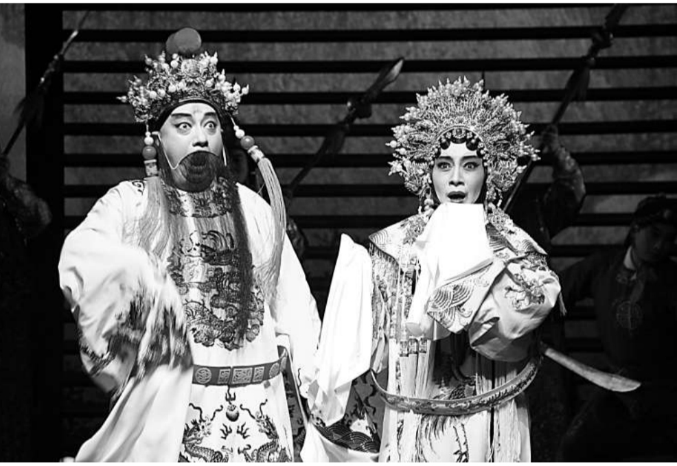
漁陽聲鼓動地來

內地連續劇《保衛延安》中有個鏡頭令我久久難忘：彭德懷司令員巡視戰場，見戰士在橫七豎八的國民黨兵屍體上隨意走動，正色道：「要尊重，他們也是人哪！」無獨有偶——另一部電視劇《亮劍》中也有類似場面，師長李雲龍看到橫陳的敵兵屍體，對正在清理現場的戰士喝道：「你不會慢一點嗎？他們也是老百姓……」於是想起「往者已矣、死者為大」的古訓，對生命的敬畏、對死者的尊重，或許正是做人處世最起碼的道德底線。尊重逝者，就是尊重生命，也是尊重自己。讓死者安息，靜靜遠去，不要