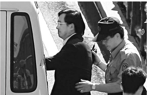
陳水扁抗告失敗，至少還要呆在看守所兩個月（資料圖片）

【本報訊】綜合中通社及中央社二十一日報道：陳水扁不滿第三度遭台北地方法院裁定延長羈押，以及台北地院駁回他的停押聲請，委託公設辯護人提出抗告，台灣高等法院合議庭二十一日下午裁定出爐，以陳水扁涉犯重罪，有逃亡、串證、滅證之虞，將他的兩件抗告都駁回。