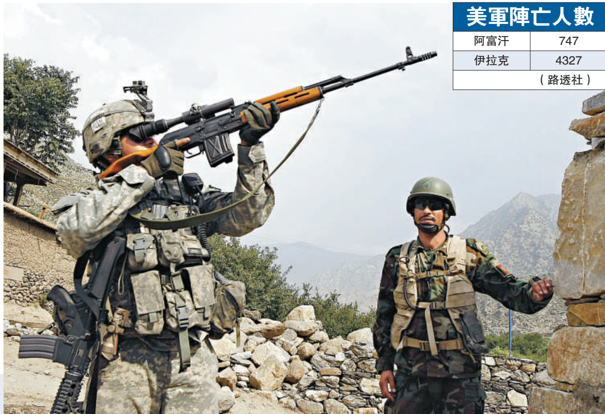
▶一名美軍士兵(左)與阿富汗政府軍二十一日在阿富汗庫納爾省的一個村莊巡邏

美國此次在阿富汗的戰略轉變始於塔利班武裝分子的襲擊急劇上升之後。去年，美國和北約駐阿安全部隊傷亡超過歷史最高水平。本月十八日，美國戰鬥機擊毀，兩名機上人員死亡，使七月份駐阿部隊死亡人數增加到五十以上，成為死亡人數最多的一個月。這個數字比以前傷亡最重的二〇〇八年六月和八月都要大，平均每天有兩名士兵死亡，已經接近了伊拉克戰爭的最高紀錄。