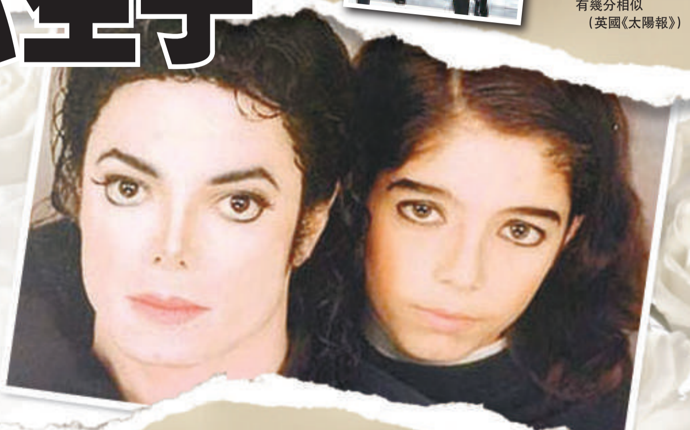
▲米高曾與小巴蒂公開亮相