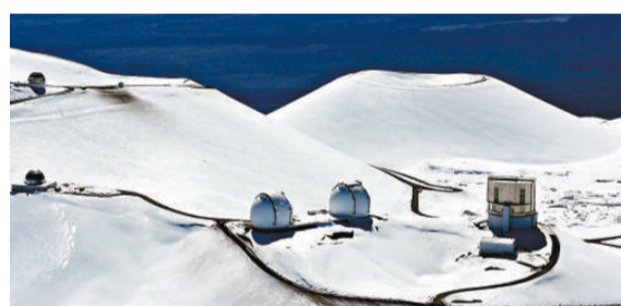
▲「三十米望遠鏡」的選址：冒納凱阿火山頂（美聯社）

涵蓋可視光到紅外線波長。由於望遠鏡面寬廣，因此能夠匯聚足夠光源，清楚看見遙遠星空，一窺銀河形成之初的恆星。銀河形成的時間大約在宇宙大霹靂之後的四億年左右。（美聯社）