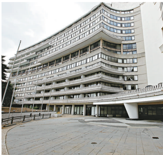
▲世界著名的水門酒店曾是華盛頓最豪華的酒店之一

這間酒店樓高十二層，有二百五十一個房間，建於六十年代末期，一度被譽為華盛頓最佳的酒店。兩年前酒店關閉進行翻新工程，但業主其後財困，無力向 PB Capital Corp 償還四千萬美元貸款。酒店最終被債權人收回。（綜合報道）