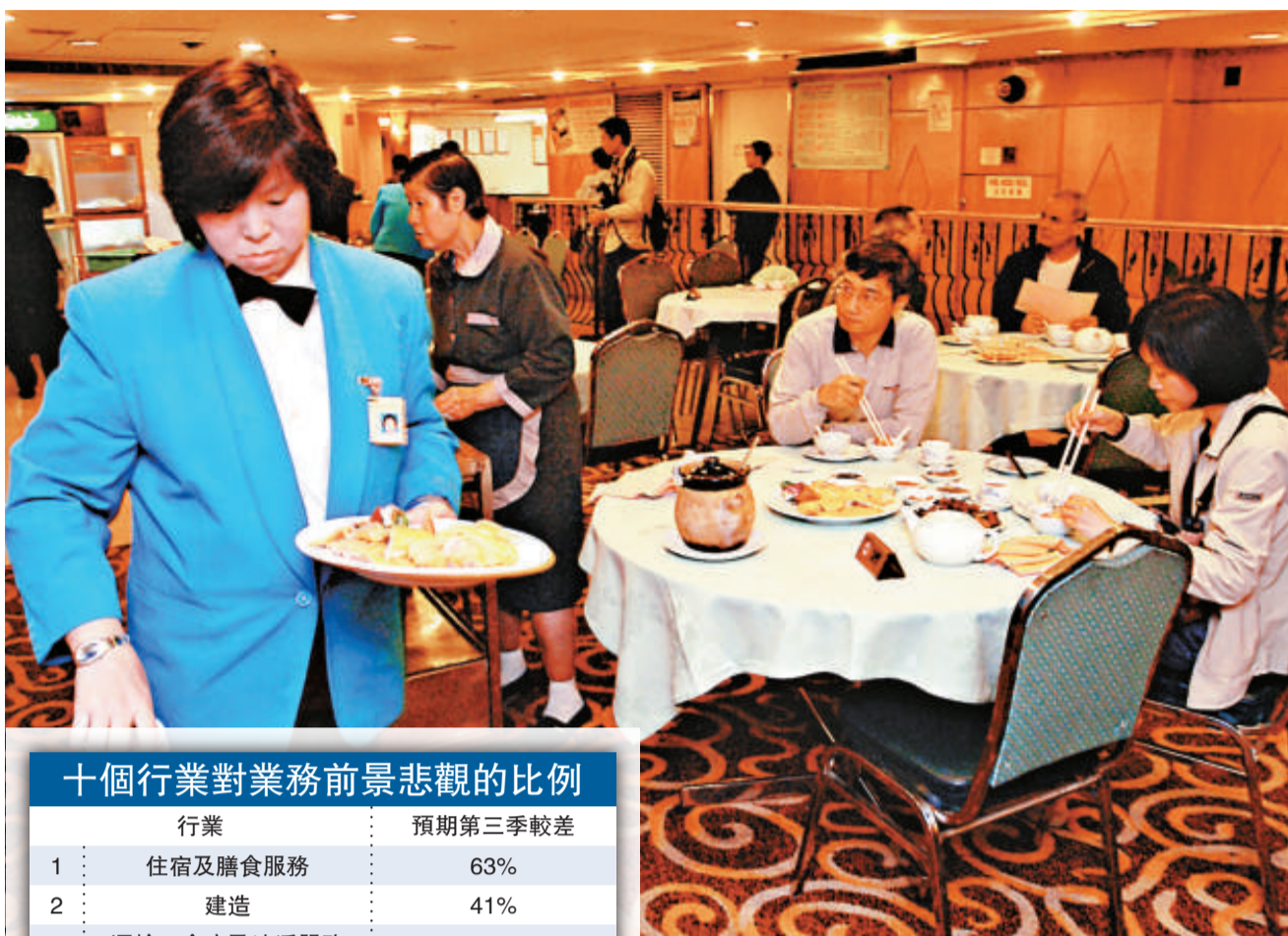
▲飲食界對第三季的展望仍然悲觀

另外，在大部分行業中，多數受訪者預期今年第三季的貨品售價或服務收費，與今年第二季大致維持不變。在住宿及膳食服務業中，預期他們所提供食品的價格或服務的收費下降的受訪者，顯著比預期上升者為多；建築業的受訪者對投標價格預期變動則持相若意見。