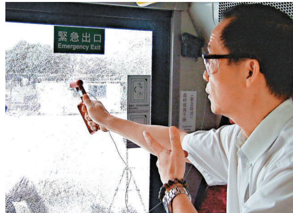
▲九巴新車下層緊急出口的太平門已採用強化玻璃