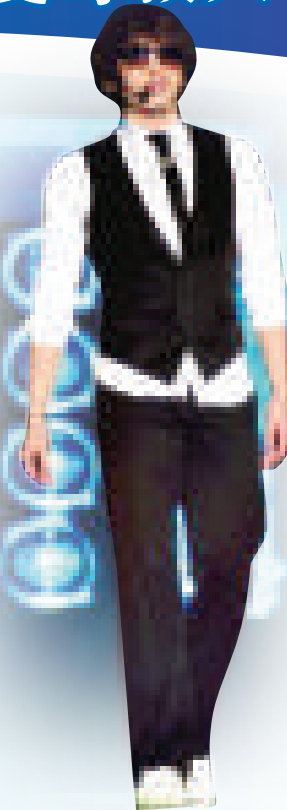
▲Rain主演的新片《忍者殺手》，公開預告片