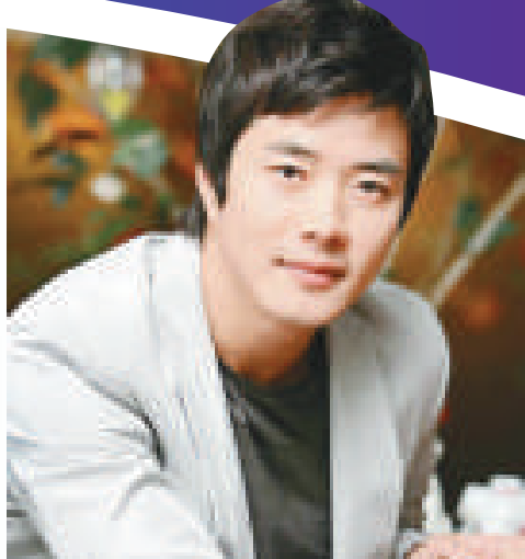
▲權相佑有望參演荷里活片《青蜂俠》，飾演當年李小龍扮演過的加藤