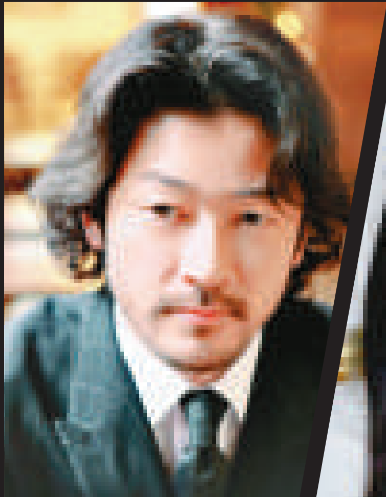
▲淺野忠信與Chara日前宣布離婚，結束十四年的婚姻