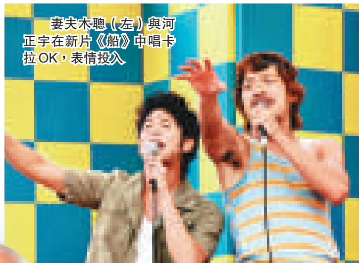
妻夫木聰（左）與河正宇在新片《船》中唱卡拉OK，表情投入

妻夫木聰在戲中與河正宇合作販毒，隨後互相了解，成為莫逆之交。戲中一幕講述兩人參加小鎮的卡拉OK大會，使兩人打開心扉，是極為重要的一幕。據知為了遷就鏡頭，兩人一共唱了三次之多，但一次NG也沒有，河正宇更以純正日語唱畢全曲。