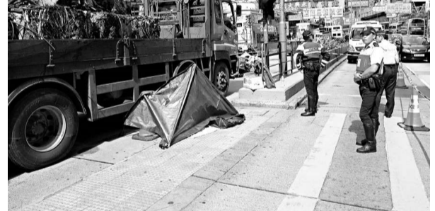
輾死老婦的運廢鐵貨車涉嫌超載

由於沒尋獲目擊者，警方呼籲市民有資料可致電 2773 5258 與負責調查的西九龍交通部特別意外調查隊聯絡。現場消息稱，事件不排除有人心急過馬路，胡亂走出引發意外，但真正原因有待調查。