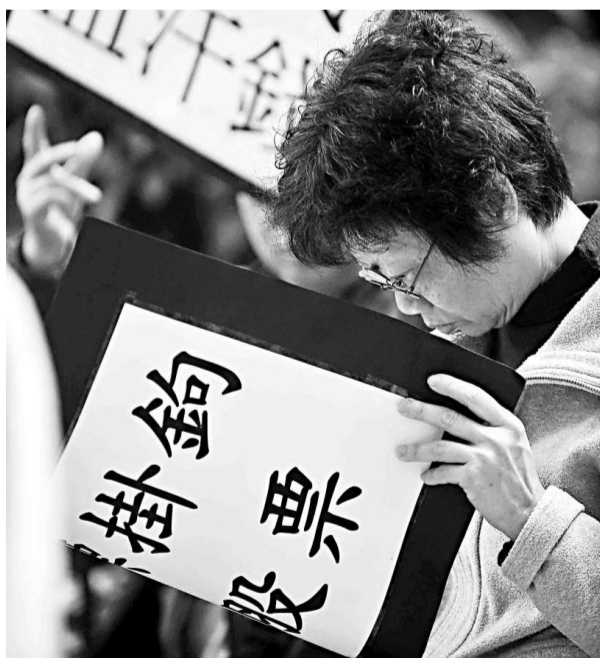
金管局下月初將發信給所有迷債投資者，通知他們是否合資格獲得賠償（資料圖片）

【本報訊】警方昨案控告兩名分別四十歲及四十八歲男子合共一項謀殺罪。他們涉嫌與七月二十二日一名三十九歲男子在油麻地窩打老道果欄與人爭執後遭人追殺有關，傷者被發現時昏迷倒地，其後被送往廣華醫院，最終證實死亡。驗屍結果顯示，他胸部受刀傷致死。該兩名男子將於七月二十七日上午九時在九龍裁判法院提堂。