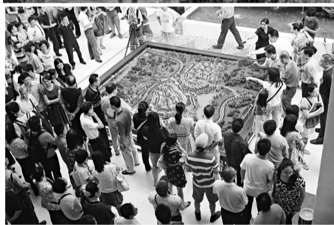
◀在從化看別墅的廣州市民 (本報攝)