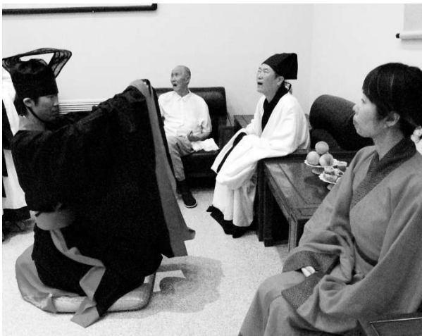
馮韓十八歲生日舉行加冠禮