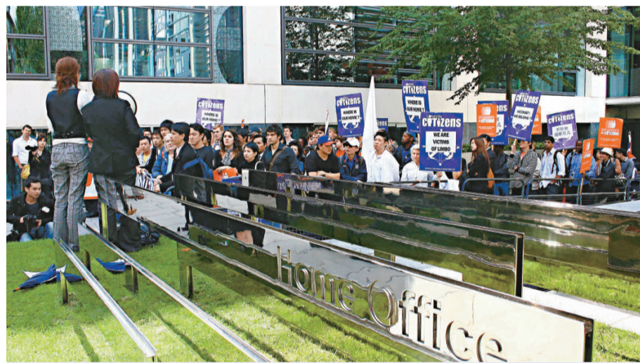
近百名因英國移民條例收緊而變成無國籍「人球」的馬來西亞華裔人士及其支持者，二十七日在英國內政部外手舉標牌，高喊口號，力爭自己的合法身份

【本報訊】中新社倫敦二十七日消息：近百名因英國移民條例收緊而變成無國籍「人球」的馬來西亞華裔人士及其支持者，星期一在英國內政部外示威，力爭自己的合法身份。