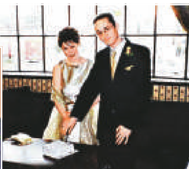
▲二〇〇〇年，霍恩與第三任丈夫、一名網站設計師切結婚蛋糕 ▼二〇〇二年，霍恩在火車上遇到了第四任丈夫，並在四個星期後與其結婚