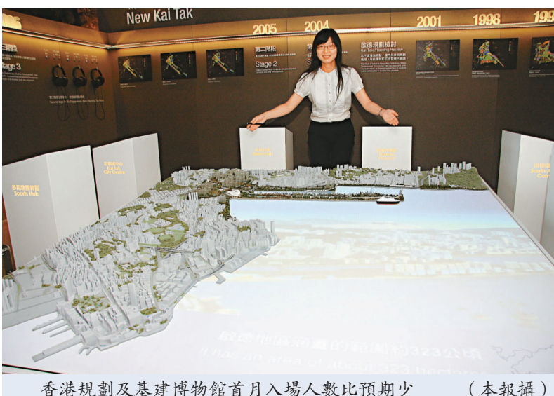
香港規劃及基建博物館首月入場人數比預期少

因愛丁堡廣場舊址擴建而須暫遷至美利道的香港規劃及基建展覽館，以往只有四個展區，如今增加至六個展區，新啓德、可持續發展、香港的印記、運輸及物流、生活的印記及香港二〇三〇。