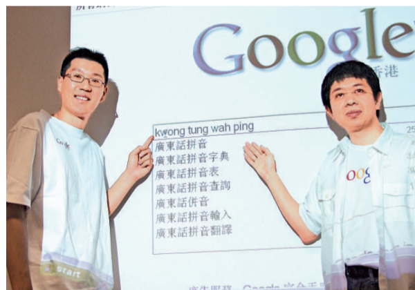
Google首創為港人而設的「廣東話拼音搜尋」功能 (本報攝)

廣東話拼音無既定規則，同一個字可能出現五花八門的拼法，例如「廣」可拼成[kwong]，亦可拼成[kwang]。隨便輸入其中一種拼法能否出現同一個字？Google稱，項目研發團隊從兩年前就開始搜集資料，參考不同數據及拼音方式，「無論輸入哪種拼法」都能得到相關的結果。「廣東話搜尋建議」將適用於Google香港繁體中文版。