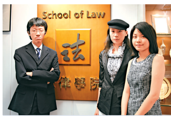
三位城大法律學院學生分別獲牛津大學及劍橋大學錄錄修讀法學碩士課程 (本報攝)

在正生五年，美詩曾想過早早回家見母親，但今天她的心態已不再相同：「我仍會留在正生，為再生人士服務。雖然很掛着媽媽，媽媽也掛着我，但她會明白我的選擇，她也想我幫助同我一樣經歷的人，做有意義的事。」