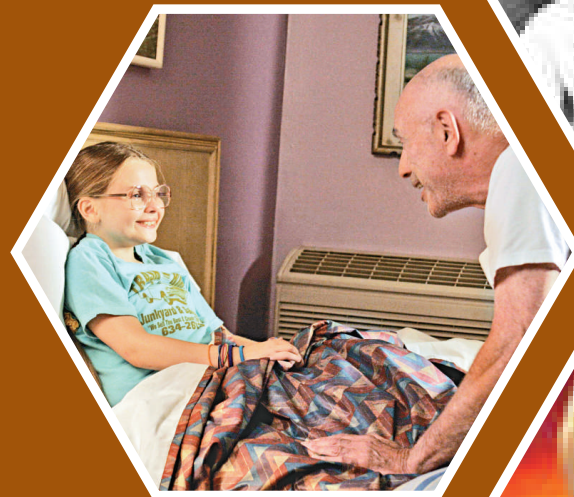
▲《陽光小姐》講述爺孫情