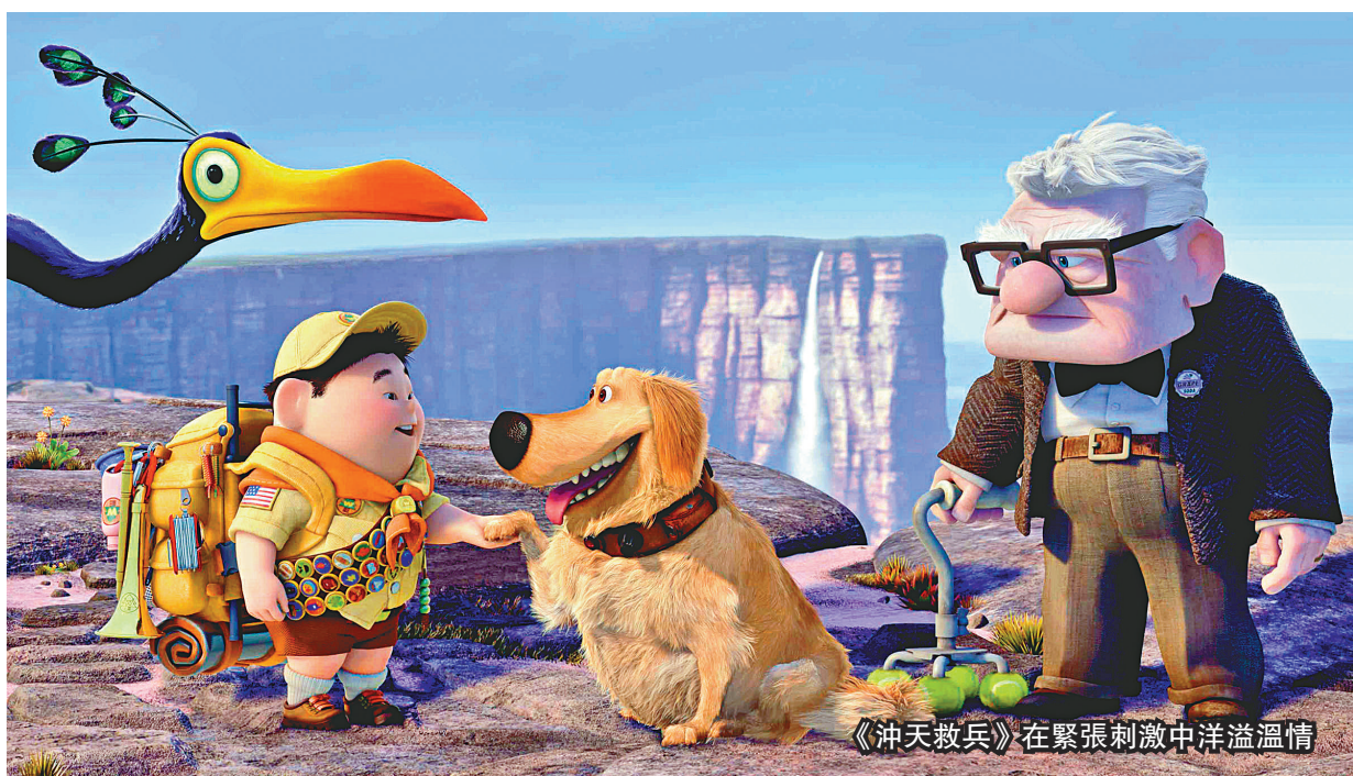
《冲天救兵》在緊張刺激中洋溢溫情

天真活潑，不知天高地厚的小孩子，和頑固執著，深諳世事人情的老人家，走在一起會否「水溝油」、「火星碰地球」？其實，活到一把年紀的老人更多時候最能豁出去，放下人生的種種枷鎖。一班最會說故事的荷里活做夢人，最近就利用一段老人與小孩的忘年友誼，炮製了感動人心的《冲天救兵》（Up），片中老頑童與胖小孩成為互相了解的好朋友。