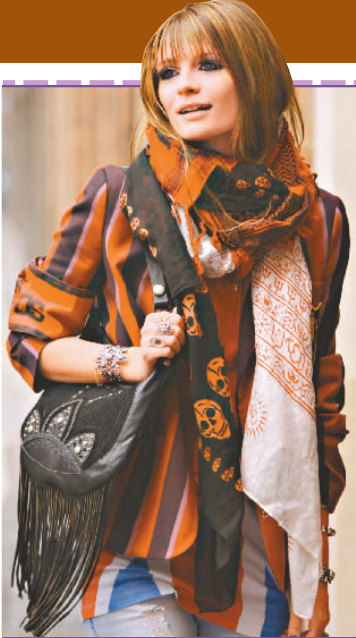
▲美莎送院原因成謎