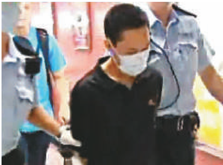
▲搶手機疑犯被押返警署