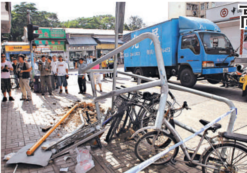
▲事發當日貨車衝上行人路掃毀路欄撞倒一男三女途人，81歲老翁被捲進車底死亡

奇華餅家發言人表示，會盡力協助受傷員工及其家屬。經醫生診斷，該員工右手傷勢須接受矯型手術，由於肇事原因正在調查中，暫時未能交代。發言人又說，公司為確保職業安全，向所有員工提供安全操作訓練，並成立委員會，每星期檢查工廠的職業安全情況。