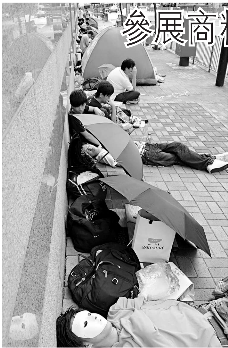
▲大批動漫迷自昨午起已在會場外輪候