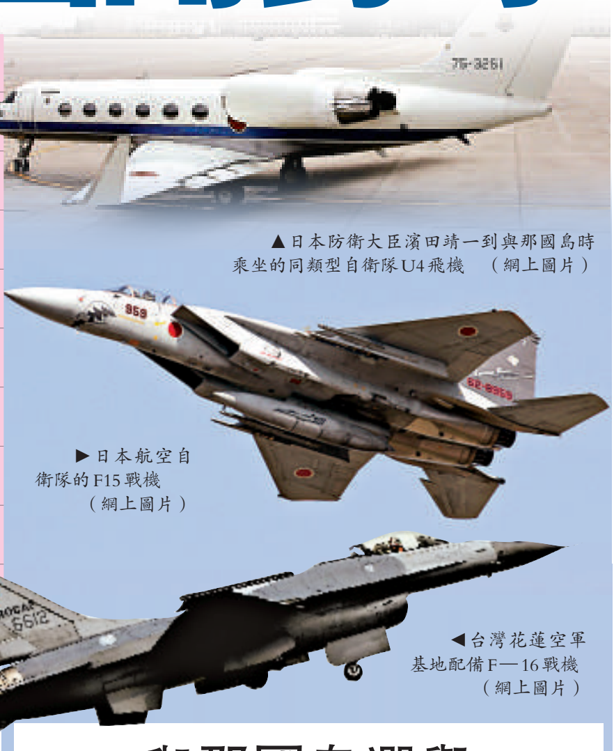
▲日本防衛大臣濱田靖一到與那國島時乘坐的同類型自衛隊U4飛機（網上圖片）

發生摩擦的地區靠近「領土主權」有過爭執的釣魚島群島，日本方面擔心與台灣發生的爭執，如對台灣施加壓力，會牽涉到與大陸的問題，因此當時防衛廳只表示「非常困擾，這是外交問題不予置評」。