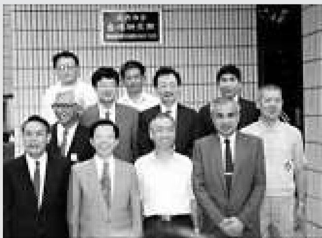
▼ 1990年，呂秀蓮（左三）回祖地福建南靖田中村祭祖尋根，在廈時訪問廈門大學台灣研究所並合影（陳孔立提供）

▼ 1993年，謝長廷（前排左二）、姚嘉文（前排左四）等民進黨人士訪問廈門大學台灣研究所並合影（陳孔立提供）