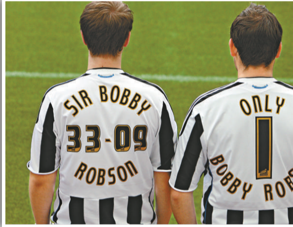
▲球迷穿著印有只有一位卜比笠臣的球衣向名帥致敬