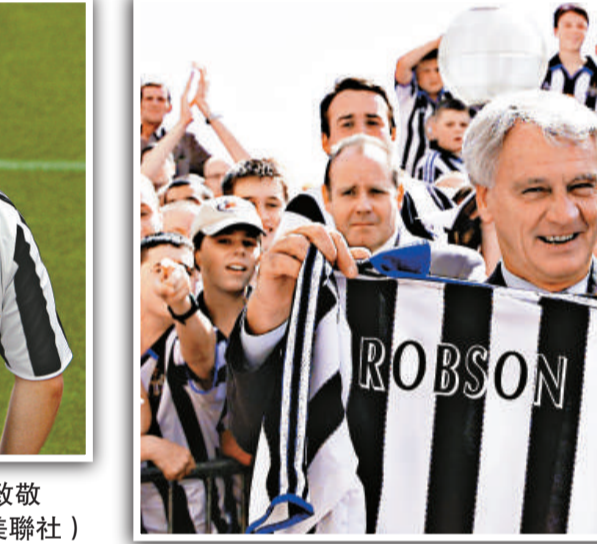
▲卜比笠臣深受英國球迷擁戴，德高望重