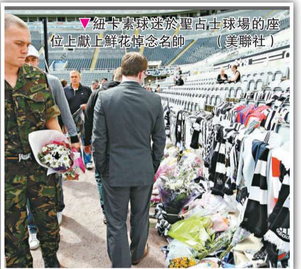
▲紐卡素球迷於聖占士球場的座位上獻上鮮花悼念名帥