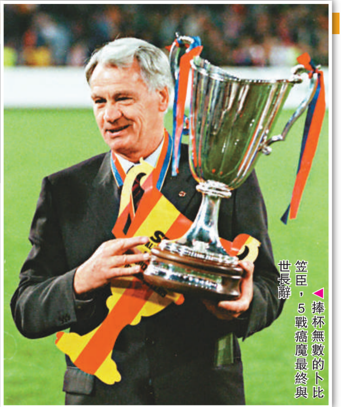
▲5戰病魔最終與世長辭的卜比