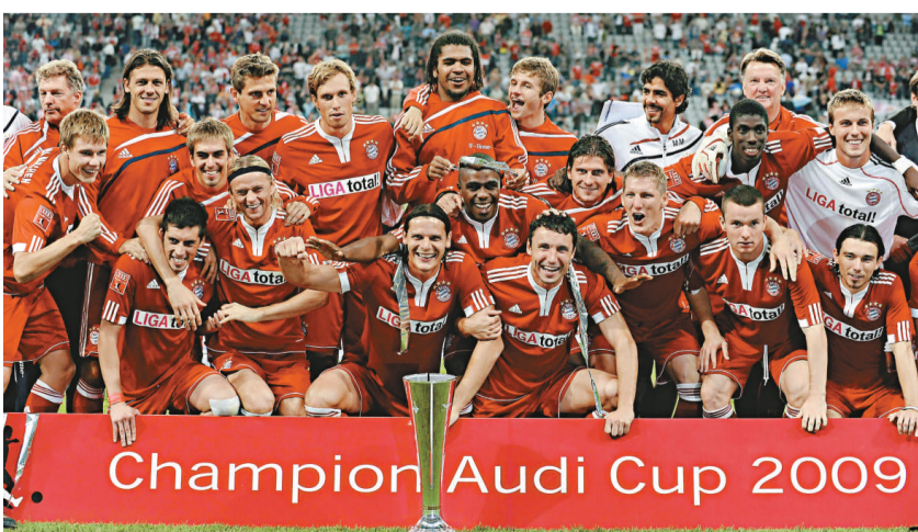
▲拜仁奪得奧迪杯，於新賽季先取頭冠