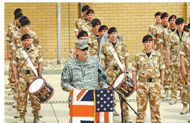
駐伊拉克多國部隊將領在英軍撤出儀式上致詞

在伊拉克的外國駐軍人數中，英國的駐軍排名第二，在二〇〇三年三月及四月達到四萬六千人的高峰。英國自出兵伊拉克以來，有一百七十九名英軍在當地陣亡。