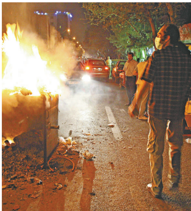
伊朗反政府示威者三十日在德黑蘭焚燒雜物

示威發起人表示已有一萬人在要求特赦他信的請願書上簽署。這場運動正由曼谷延伸至其他地區，目標為搜集五百萬個簽名。泰國首相阿披實星期四警告他信的支持者，不要為他信進行簽名請願運動。阿披實說，泰王特赦只能由他信自己或他家人親自爭取，而且只能在他服完部分刑期後才能提出。