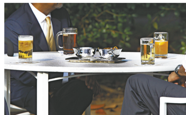
奧巴馬、拜登、克勞利和蓋茨四人各自選擇自己喜歡的啤酒，分別是Bud Light、Buckler、Blue Moon和Sam Adams Light

白宮對此調查結果不以為然，白宮發言人吉布斯表示，他不認為這些數字代表什麼，沒有人會為這些數字擔憂。他說：「你看，總統並沒有很多時間去關注調查，他也不關注調查數字的漲跌。如果我們對數字關注，我們早在兩年前的夏天就退出了，也不會想要開始競選總統。」