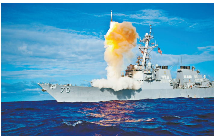
「霍珀」號導彈驅逐艦發射一枚導彈，隨後攔截了一枚從夏威夷發射的短程洲際彈道導彈

據介紹，三十日的試驗是美國軍方迄今為止利用裝備「宙斯盾」彈道導彈防禦系統的軍艦進行的第二十三次導彈防禦試驗，也是第十九次成功的試驗。